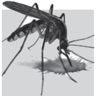
Januari-Februari 2020 38 orang derita DBD 2019 Satu orang meninggal dan 199 kasus DBD Masyarakat dihimbau lakukan pemberantasan sarang nyamuk

tanaman anti nyamuk," ucapnya. Yayuk menyebutkan kasus DBD di Tahun 2019, telah merenggut nyawa satu orang warga asal Desa Kalangsari, Kecamatan Rengasdengklok. Sepanjang tahun terdapat 199 kasus warga yang terkena DBD. "Bahkan tahun lalu ada yang meninggal satu orang," bebernya. (aef/ysp)