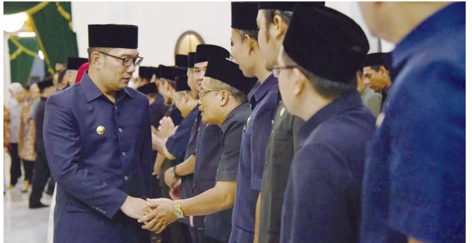
SAPA KEPSEK: Gubernur Jabar, Ridwan Kamil saat menyalami para kepala sekolah SMA/SMK yang sudah dilantik di Gedung Sate, kemarin (20/2).