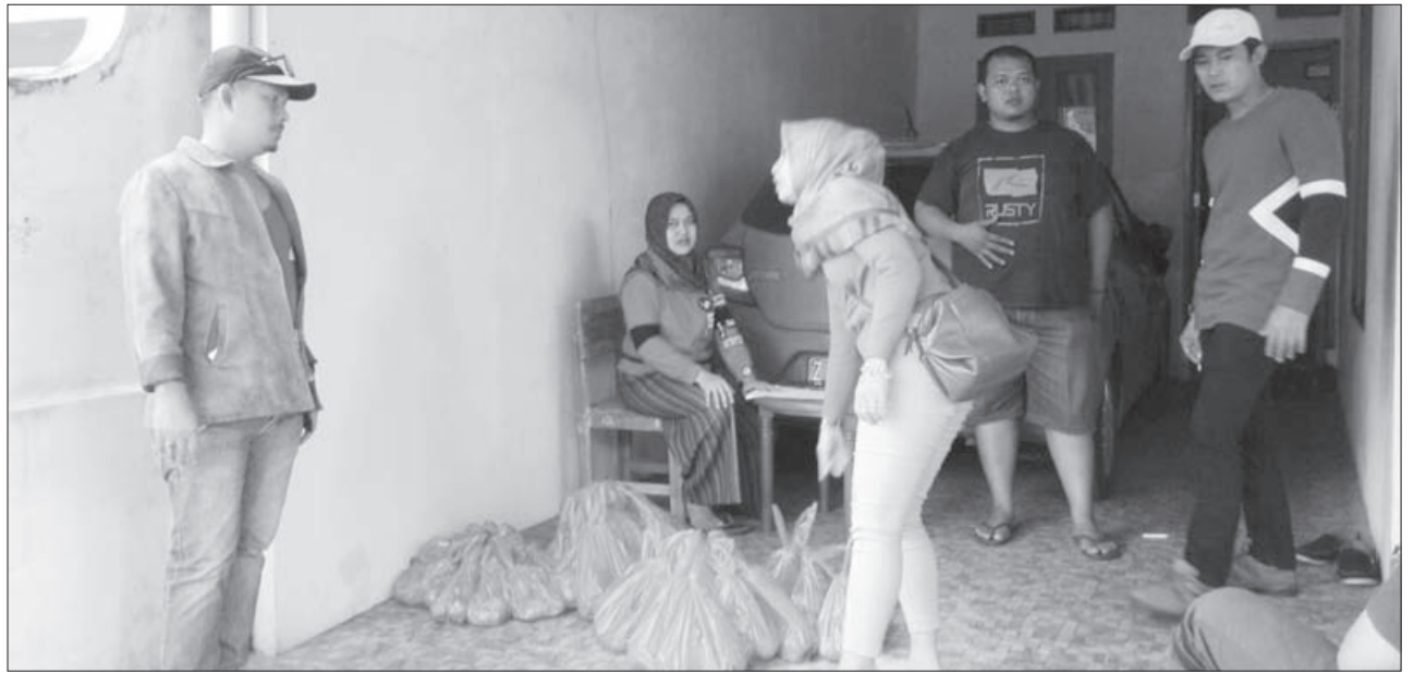
SALURKAN BANTUAN: Sejumlah petugas tengah menyalurkan bantuan PKH kepada warga penerima manfaat di salahsatu desa di Kecamatan Jatinangor. Namun sayang, ada salahsatu penerima bantuan sudah memiliki mobil lantaran data penerima belum di-upgrade.

"Memang, di lapangan masih ada masukan dari masyarakat terkait kriteria penerima pemanfaat. Ada yang memang membutuhkan ada juga yang sudah mampu atau sudah tidak layak lagi," katanya, kemarin (20/2). Syarif menuturkan, berdasarkan kriteria tersebut, masih ada beberapa warga yang memang secara fakta, memerlukan bantuan dan ada juga yang sudah tidak layak menerima bantuan. "Ada sekitar 3.697 penerima PKH dan KPM yang ada di Kecamatan Jatinangor. Dan semuanya akan kita evaluasi. Kita akan melibatkan TNI Polri yang ada di desa yang akan men-