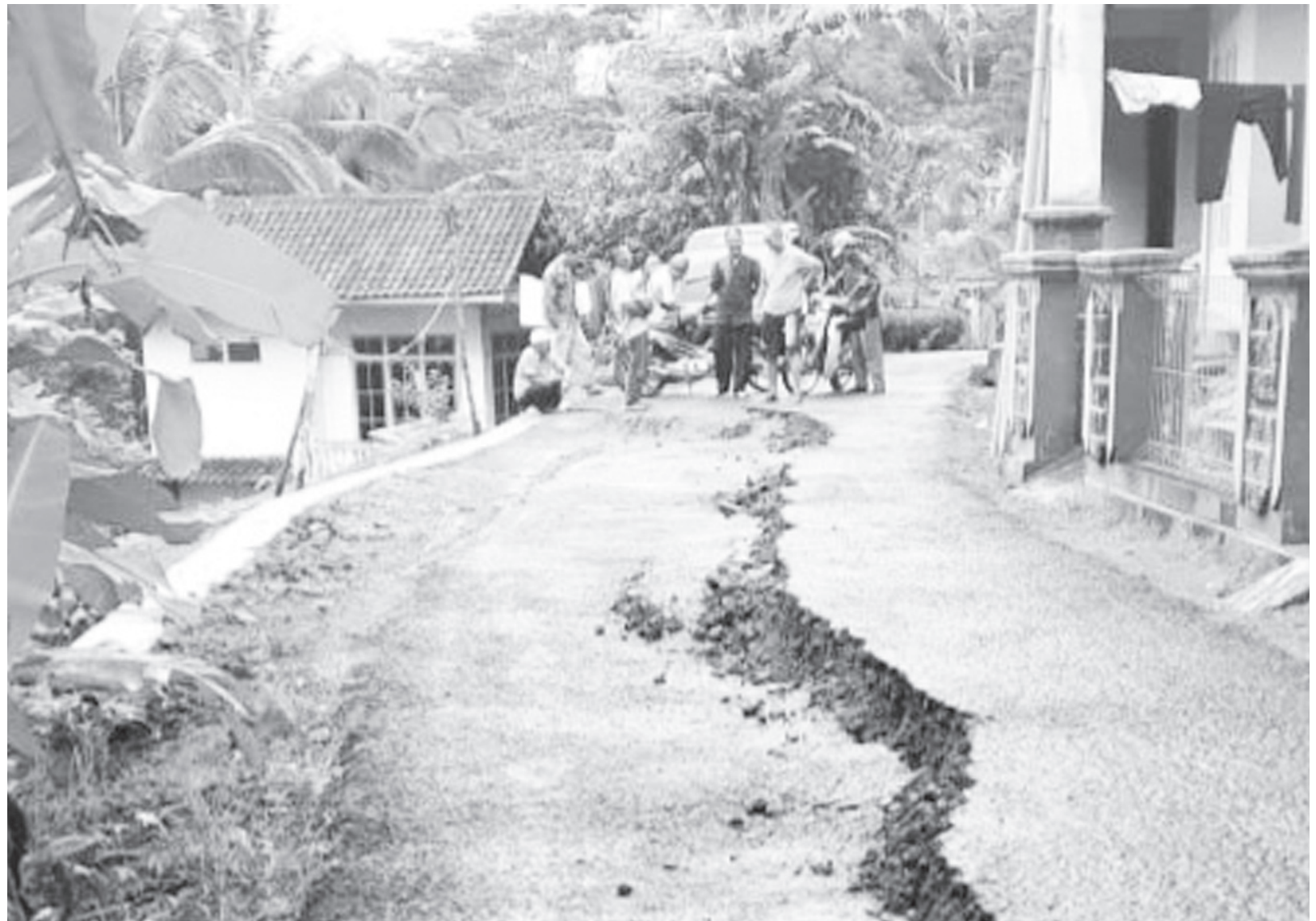
AMBLAS: Jalan desa perbatasan Ciamis-Kuningan amblas sepanjang 10 meter. Bencana serupa juga terjadi di Kecamatan Cipaku, Kabupaten Ciamis. Jika terjadi hujan terus menerus, bukan tidak mungkin di daerah perbatasan Ciamis-Kuningan terjadi musibah serupa, karena itu warga diimbau waspada.

Kata dia, program ini secara instan mengurangi pengangguran. Karena setelah dilatih, mereka bisa langsung bekerja. "Peserta kita alokasikan 100 orang. Tapi yang mendaftarkan hampir 200 orang. Maka kalau ini berhasil, kita lanjutkan ke tahap kedua," katanya. (rezza rizaldi)