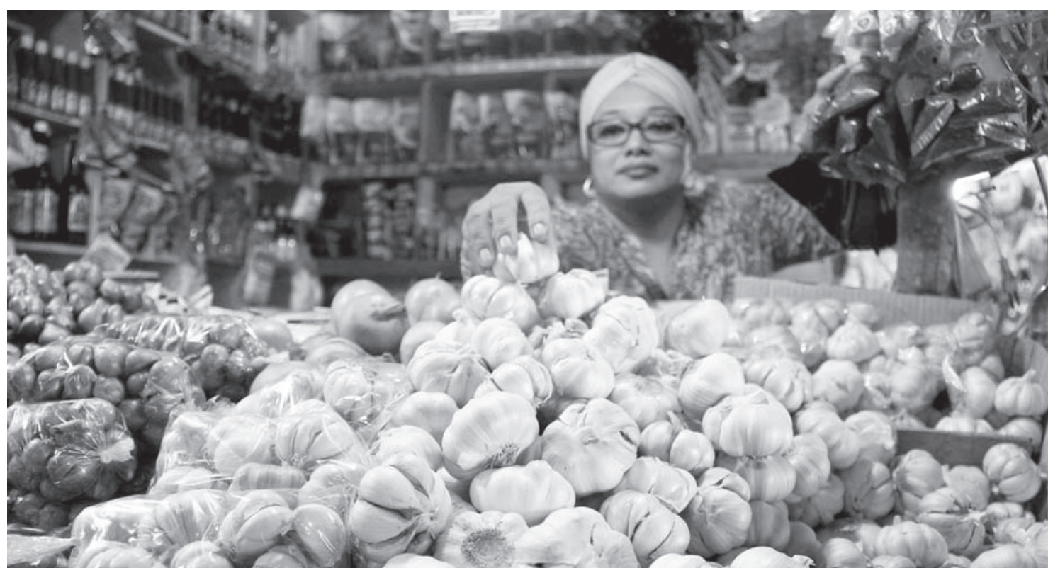
OMSET TURUN: Dalam beberapa minggu terakhir ini harga bawang putih naik hingga Rp 55-60 ribu per kilogram. Kenaikan tersebut berdampak pada penurunan omset penjualan.

"Stok masih aman, menurut pedagang. Selain bawang, yang mengalami kenaikan belum ada. Telur naik sedikit tapi masih bisa diatasi," tandasnya. (mg3/ziz)