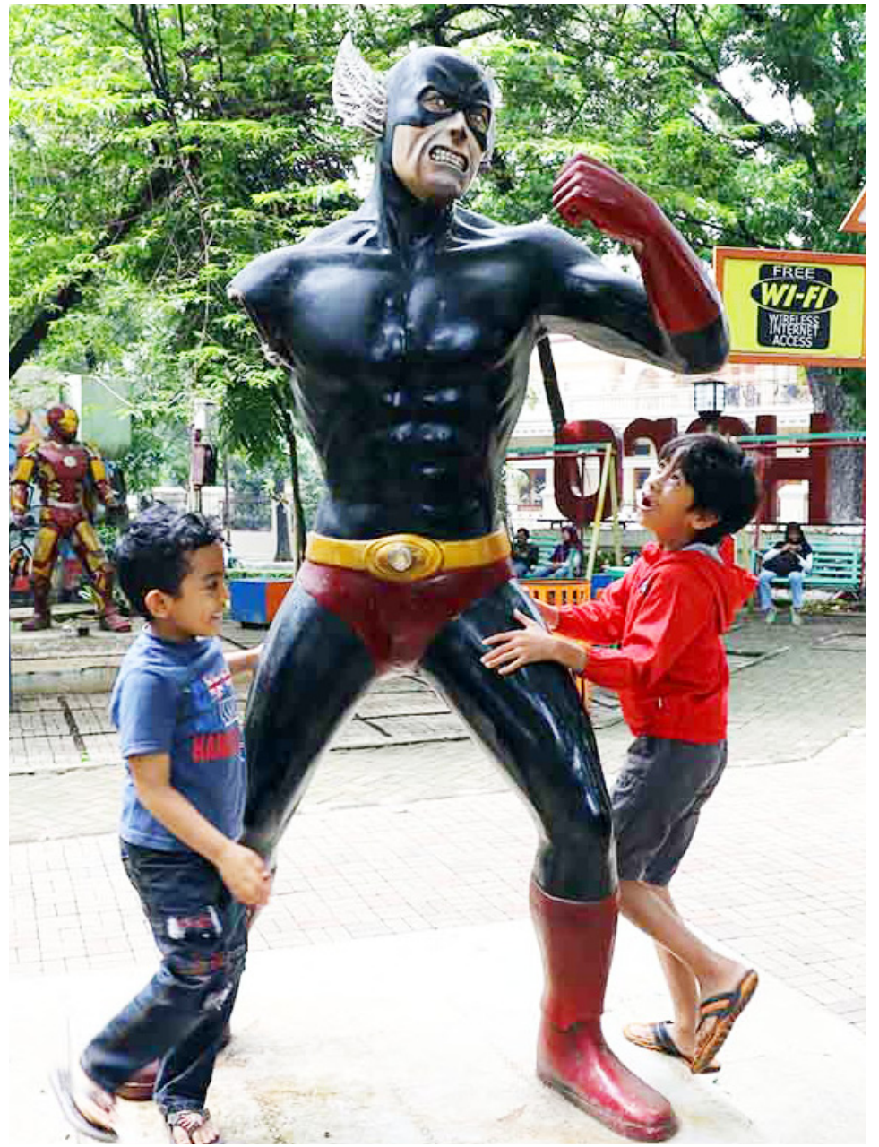
SAPRAS RUSAK: Penurunan kualitas taman dan rusaknya beberapa sarana pendukung di sejumlah taman, membuat Pemerintah Kota Bandung melalui DPKP3 akan segera merevitalisasi taman-taman tersebut.