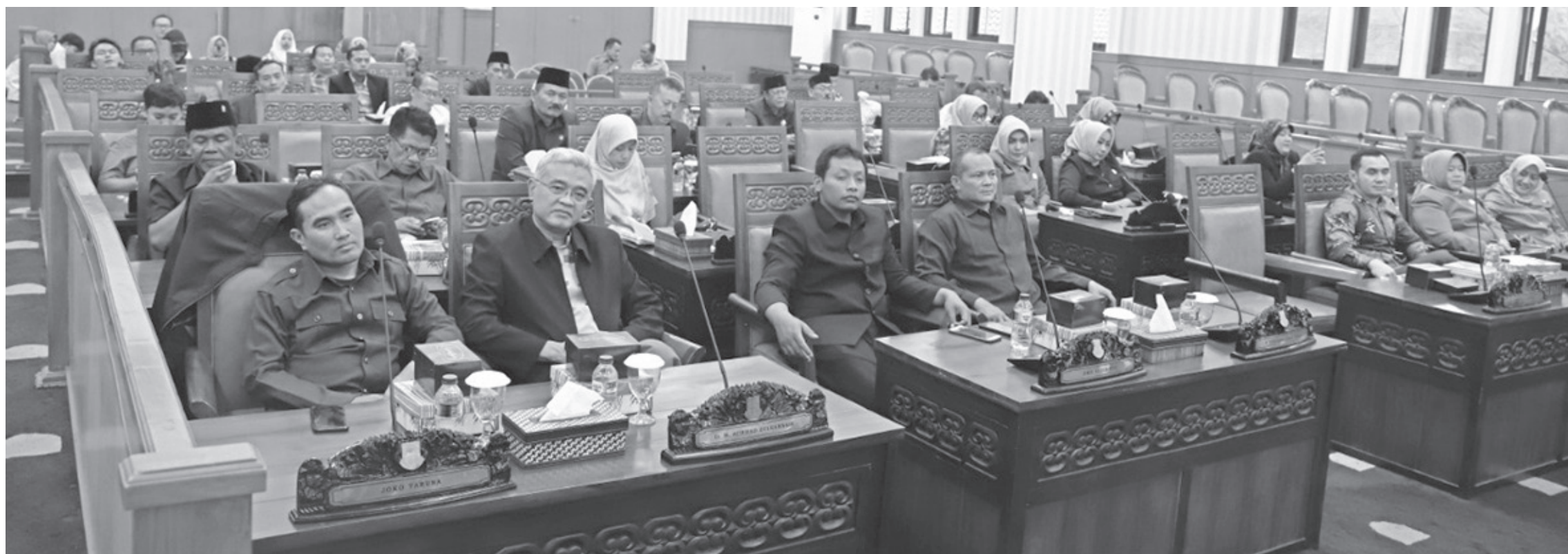
BAHAS PERDA: Para anggota Dewan Perwakilan Rakyat Daerah (DPRD) Kota Cimahi senang mengikuti rapat untuk membahas beberapa agenda kegiatan dewan dan juga pembahasan pembuatan Peraturan Daerah (Perda) baru.