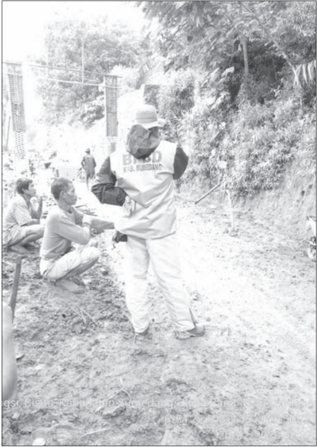
BERSIHKAN LONGSOR: Petugas gabungan membersihkan material tanah longsor di Blok Pasir Reungit Desa Cinangsi.

panitia mengemas acara dengan menarik dan beda dengan yang lain. (atp/adv)