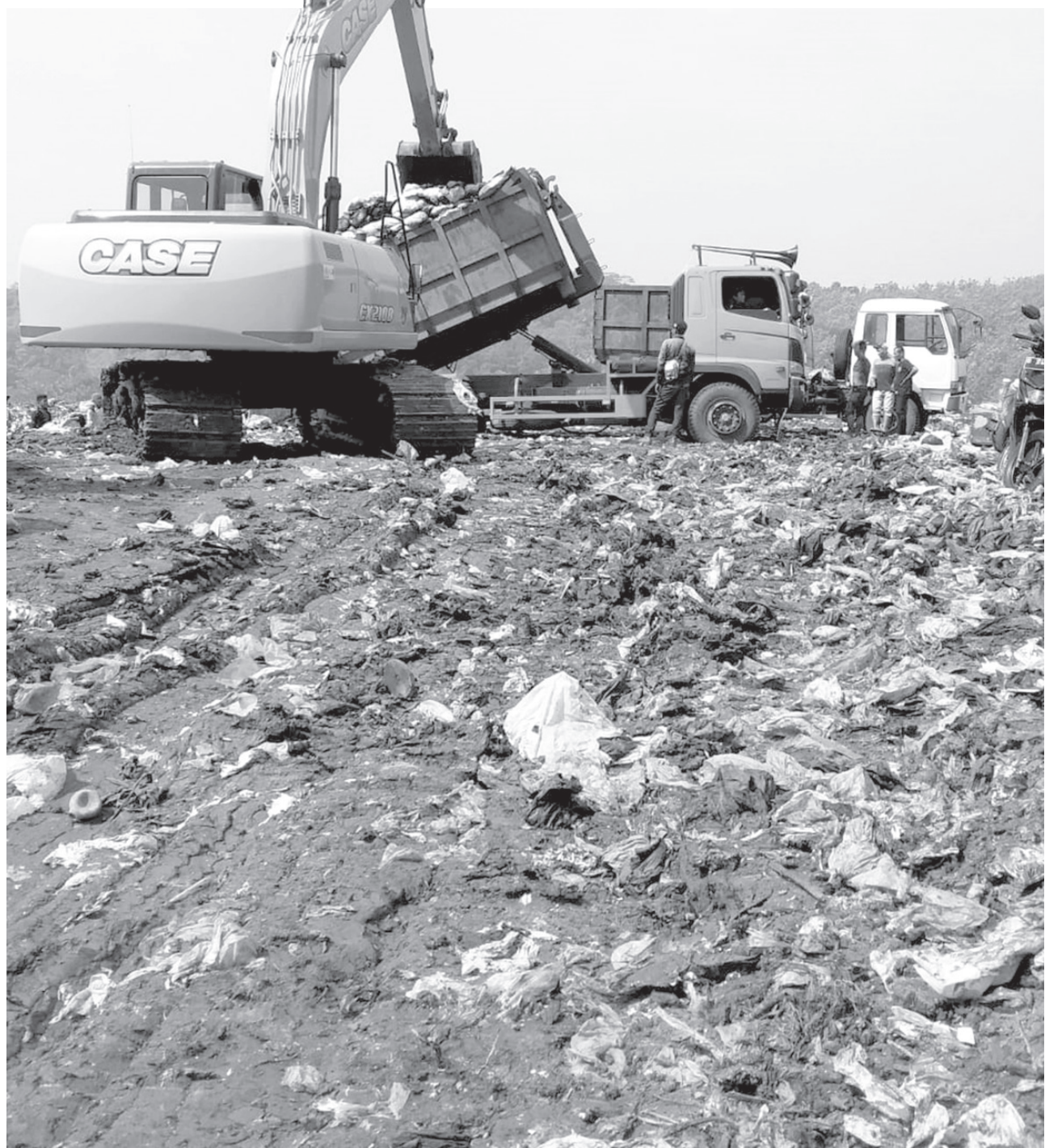
KELOLA SAMPAH: Dalam upaya mengurangi jumlah timbulan sampah, DLH Kota Cimahi saat ini terus menggalakan program Zero Waste. Selain menyasar wilayah, juga merambah sekolah-sekolah untuk melakukan edukasi penanganan sampah sejak dari sumber.