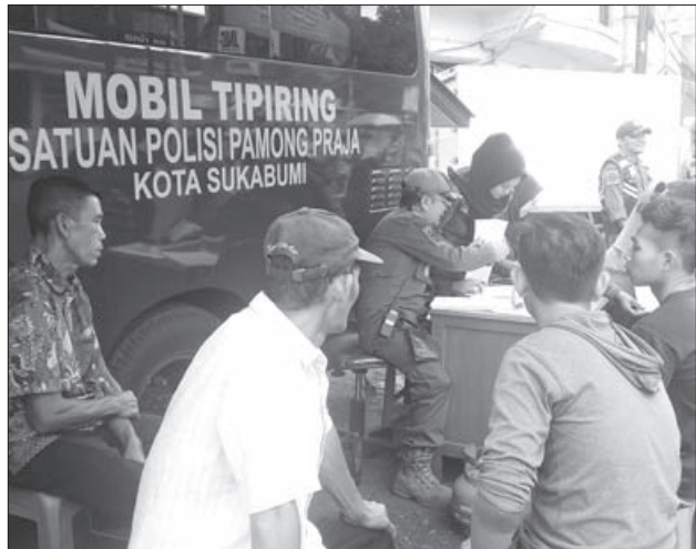
TIPIRING: Sejumlah PKL menjalani proses sidang di tempat lantaran terjaring operasi.

antara Rp50 ribu sampai Rp 100 ribu. Pelanggar didenda melalui sidang di tempat," kata Sudrajat kepada wartawan, kemarin (18/02). Sudrajat menjelaskan, denda tersebut diputuskan hakim sebagai efek jera bagi para pelanggar agar tidak berjualan di badan jalan dan trotoar. Dalam operasi kali ini, SatpolPP mendapati beberapa pedagang yang sebelumnya pernah terjaring operasi serupa. Untuk beberapa PKL yang membandel didenda dengan kelipatan. Jumlah denda berlipat tergantung berapa kali mereka kedapatan melanggar," ungkapnya. Lebih jauh Sudrajat menuturkan, operasi serupa akan terus digelar untuk memberikan edukasi kepada para pedagang yang