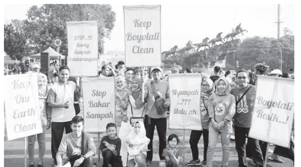
GELAR AKSI: Puluhan warga memperingati HPSN dengan melakukan aksi pungut sampah. Usai memunguti sampah, warga membentangkan berbagai spanduk yang berisi pesan agar warga membuang sampah pada tempatnya.

"Saya melihat bagaimana materinya sangat luar biasa, saya berharap ini betul-betul ada aspek hijrah perubahan dari mindset dan spirit untuk ASN Kota Bandung dan ASN Kota Bandung lebih baik," singkat Oded. (mg2/ziz)