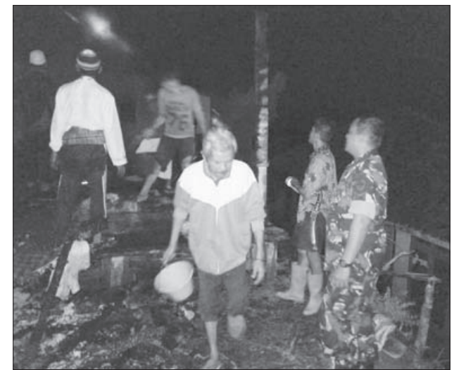
SISA KEBAKARAN: Babinsa, Babinkamtibmas, aparat desa beserta warga sekitar saat melakukan pendinginan di sisa kebakaran yang meludeskan dua rumah warga.