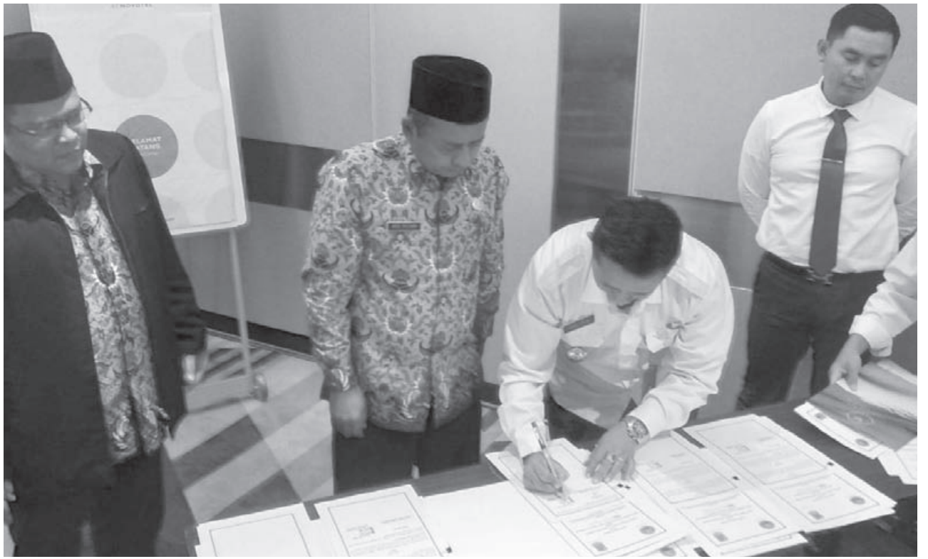
RAPAT KERJA : Penguatan sinergitas Pemkab dan BNN Karawang ini dibahas dalam rapat kerja yang dihadiri 15 OPD Kabupaten Karawang di hotel Novotel, kemarin.

Diakhir acara, BNN Karawang melakukan penandatanganan Perjanjian Kerjasama dengan sejumlah OPD Pemda Karawang diantaranya DPMD, Dinkes, Dinsos, P2TP2A, DP3A, Kominfo, Disdikpora, DPPKB dan Kesbangpol serta Satnarkoba Polres Karawang. (rie)