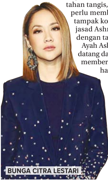
BUNGA CITRA LESTARI