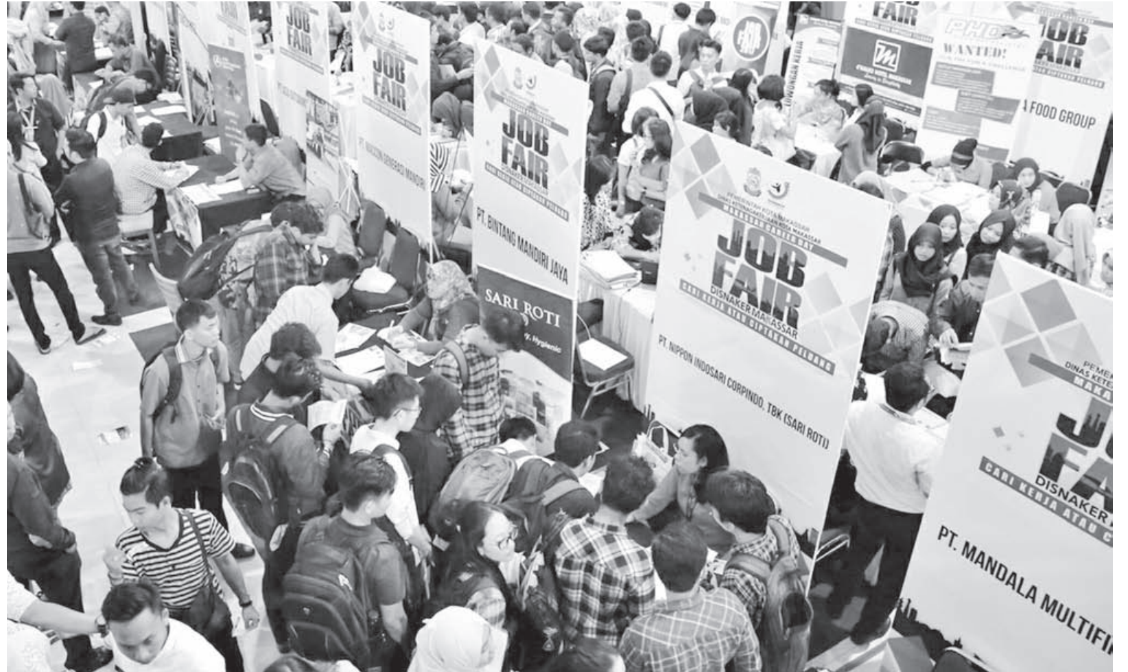
CARI KERJA: Ribuan para pencari kerja mengikuti job fair yang diselenggarakan Pemerintah Kota Bandung, beberapa waktu lalu.

"Untuk sampah di Coblong, selain sampah rumah tangga, ada juga sampah dari empat anak sungai Cikapundung. Warga, komunitas, ormas, dan OKP berkomitmen menjaga kebersihan wilayah dengan Kang Pisman ini," katanya. (rls/ziz)