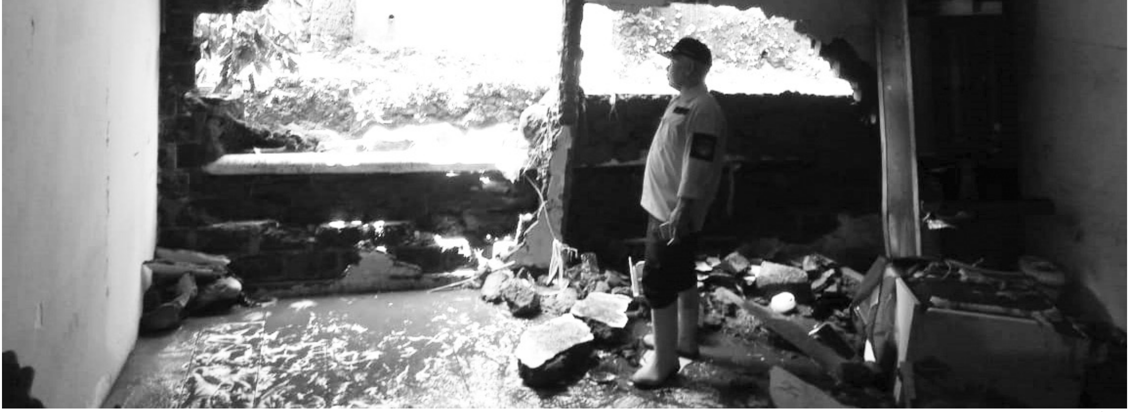
TEMBOK JEBOL: Seorang petugas BPBD saat meninjau sebuah ruangan yang jebol akibat banjir di Padalarang. Selain banjir, KBB juga diterjang pergerakan tanah dan longsor. Hingga saat ini tak ada korban jiwa hanya kerugian materi.