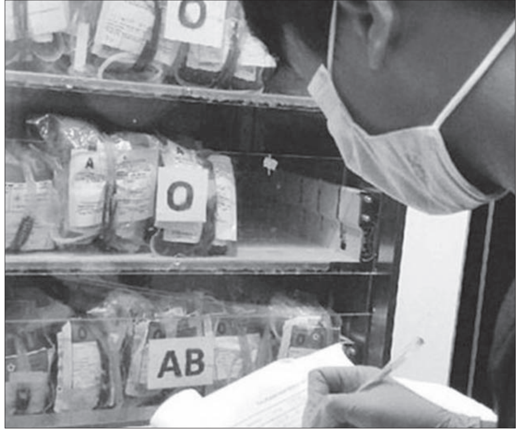
TERBATAS: Stok darah di Kabupaten Sukabumi setengahnya terserap penderita Talasemia.

Meskipun demikian, lanjut Hondo, PMI Kabupaten Sukabumi tidak sampai mengalami krisis stok darah. Pihaknya mempunyai jaringan dengan PMI dari berbagai daerah untuk menutupi kebutuhan. "Kami punya jaringan seandainya terjadi kekurangan darah. Namun kebutuhan darah itu ada trennya. Jenis yang dibutuhkan berubah-ubah, kemarin yang banyak dibutuhkan golongan darah O dan sekarang A yang dibutuhkan," pungkasnya. (job1)