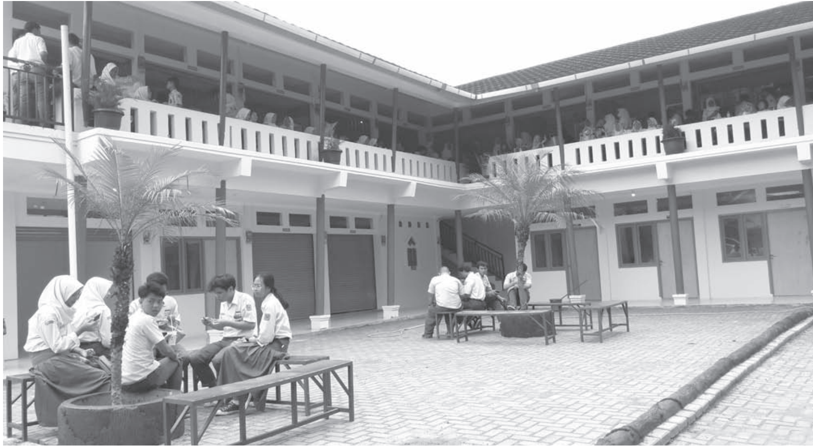
KANTIN SEHAT: Tampak asyik para siswa SMAN 10 Kota Bandung menikmati menu makanan dan minuman yang tersedia di Kantin Sehat yang terletak di halaman sekolah.