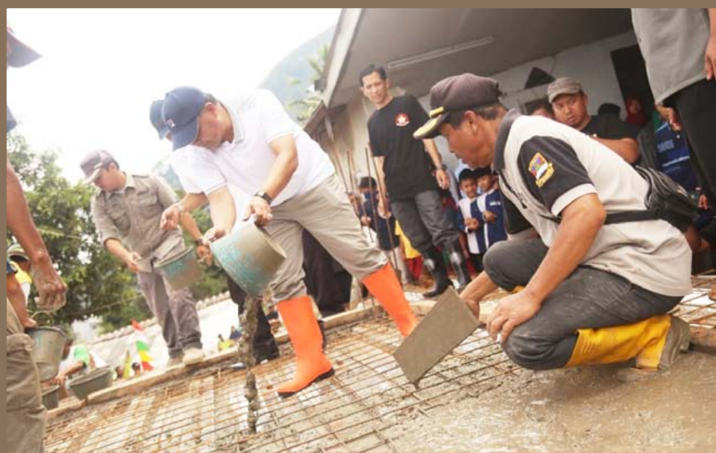
GOTONG ROYONG: Bupati Bandung Barat, Aa Umbara Sutisna saat ikut membantu warga membangun masjid, di Kampung Pasirangka, Desa Batulayang Kecamatan Cililin pada Minggu (16/2).