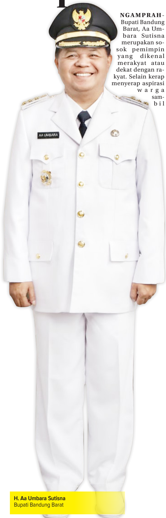
H. Aa Umbara Sutisna Bupati Bandung Barat

NGAMPRAH- Bupati Bandung Barat, Aa Umbara Sutisna merupakan sosok pemimpin yang dikenal merakyat atau dekat dengan rakyat. Selain kerap menyerap aspirasi warga