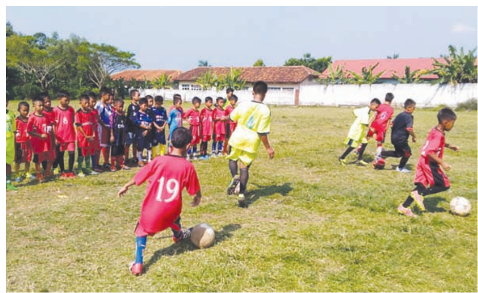
ASYIK BERMAIN: Sejumlah anak-anak terlihat menikmati permainan bola. Tahun ini, setiap kecamatan akan dibangun satu lapangan sepak bola. Program ini untuk menaikkan indeks pembangunan.