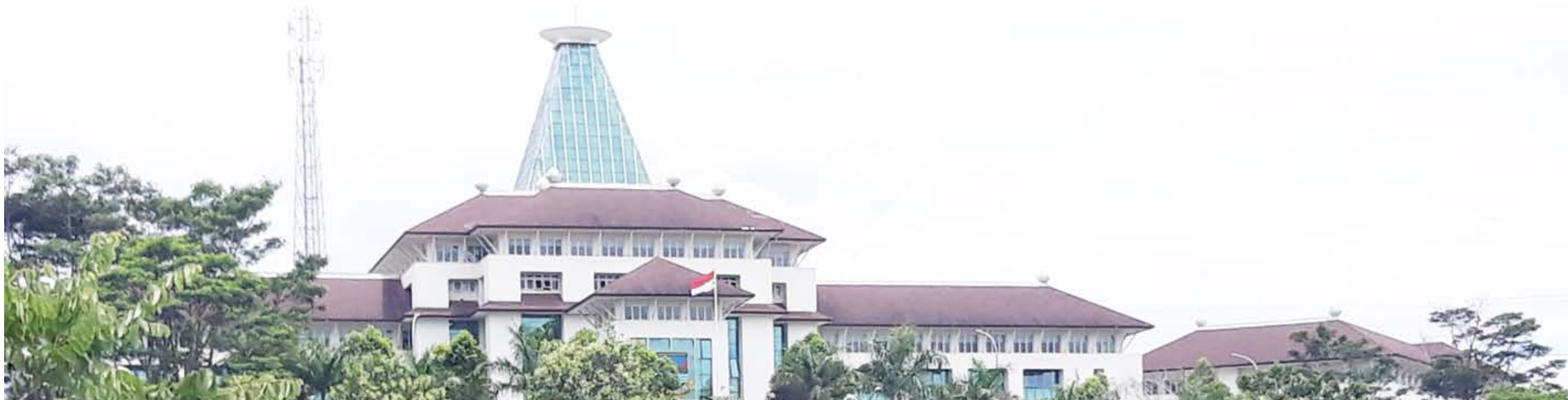
PERKANTORAN PEMERINTAHAN: Kantor Pemkab Bandung Barat berlokasi di Desa Mekarsari Kecamatan Ngamprah. Kantor ini merupakan pusat pelayanan mulai dari administrasi kependudukan, perizinan hingga pelayanan lainnya.