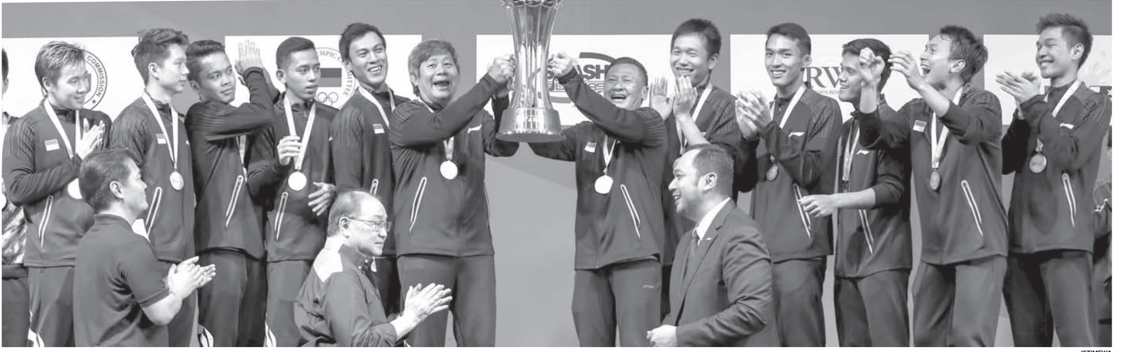
ANGKAT TROFI: Setelah Berhasil menaklukan Tim Malaysia di final, Tim bulutangkis putra Indonesia berfoto usai meraih titel Kejuaraan Beregu Badminton Asia Team Championships 2020 di Manila, Filipina.