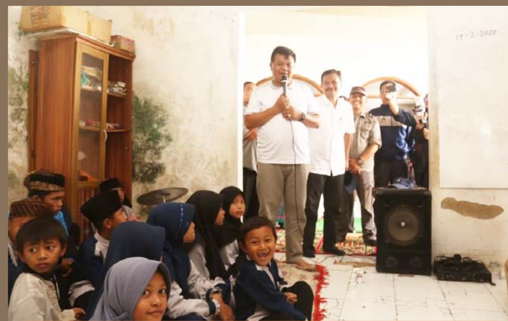
SAPA ANAK-ANAK: Bupati Bandung Barat Aa Umbara Sutisna saat memberikan sambutan sekaligus menyapa anak-anak pengajian di sebuah masjid di Cililin.