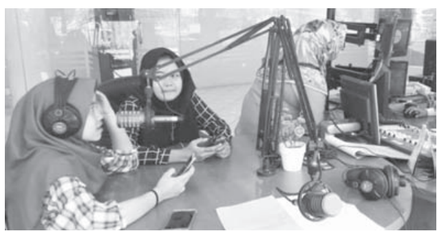
ASAH BAKAT: Sejumlah anggota ekstrakurikuler jurnalis SMPN 46 Bandung saat mengisi acara Pelangi Nusantara di RRI Bandung.

"Nah, terkadang banyak sekali kegiatan (sekolah) yang