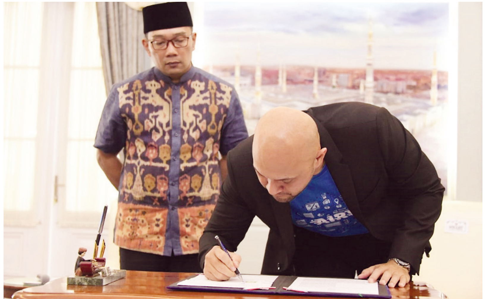
JALIN KERJA SAMA: Gubernur Jabar Ridwan Kamil saat menyaksikan proses penandatanganan kerja sama dengan perusahaan penyedia layanan booking tiket dan hotel online untuk perjalanan dinas di Gedung Pakuan, kemarin (18/2). Kerja sama ini diyakini akan lebih efisiensi dari sisi anggaran.