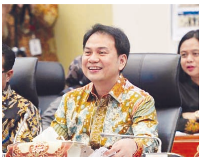
AZIZ SYAMSUDDIN Wakil Ketua DPR RI

JAKARTA- DPR RI belum juga memutuskan pembahasan Rancangan Undang-Undang (RUU) Cipta Kerja. Apakah akan dibahas di Badan Legislasi (Baleg) DPR atau dibuat Panitia Khusus (Pansus). Alasannya, Badan Musyawarah (Bamus) belum mengadakan rapat.