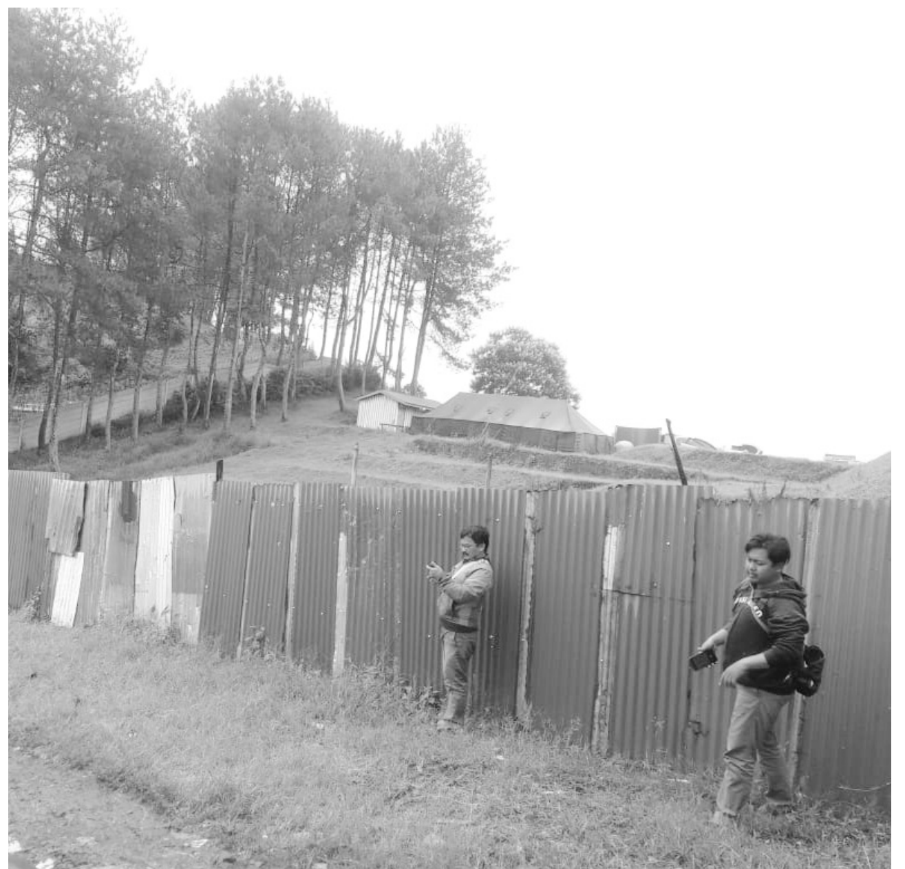
POLEMIS IZIN: Rencana pembangunan waterboom di Lembang mendapat penolakan warga. Bupati mengisyaratkan IMB keluar harus sesuai izin warga.

"Wisata di KBU itu menyumbang Pendapatan Asli Daerah (PAD). Jadi kita butuh wisata karena PAD besar dari situ," tandasnya. (mg6/drx)