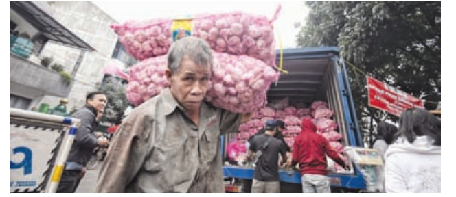
PANGGUL BARANG: Seorang kakek saat memanggul bawang putih pada kegiatan OPM yang digelar Pemprov Jabar di Pasar Astana Anyar.

inta ibu-ibu rumah tangga dan para pedagang tidak mengkhawatirkan lagi isu kenaikan bawang putih. Menurut Emil, kebutuhan bawang putih di Jabar mayoritas berasal dari impor. Pihaknya berupaya agar pemenuhan ke depan bisa datang juga dari pasokan lokal sepanjang harganya terjaga dan terjangkau oleh masyarakat. ▶ Baca Lawan... Hal 2