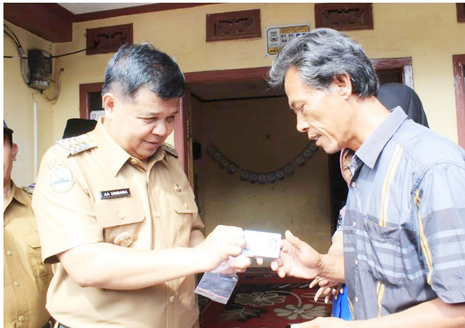
ANTARKAN E-KTP: Bupati Bandung Barat Aa Umbara Sutisna saat mengantarkan langsung e-KTP ke rumah salah seorang warga melalui program "Si Layung".

"Semoga dengan kehadiran Bupati beserta jajaran kepala dinas akan memberikan harapan juga kenyataan dalam mewujudkan pemerataan pembangunan di segala bidang. Baik itu infrastruktur jalan, kesehatan, pendidikan maupun pemberdayaan ekonomi masyarakat bisa tercapai untuk kesejahteraan seluruh masyarakat KBB," kata Bupati. (adv/drx)