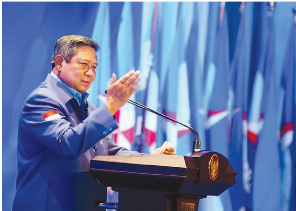
SEGERA PENSIUN: Ketua Umum Demokrat, SBY dikabarkan akan segera pensiun dalam waktu dekat. Sebagai gantinya, kedua anak SBY disiapkan sebagai penerus.

Sebelumnya, pemerintah meminta 51 ribu honorer K2 yang lulus seleksi PPPK hasil rekrutmen Februari 2019 bersabar. Tidak akan lama lagi Perpres tentang Jabatan PPPK akan terbit. (jppn/drx)