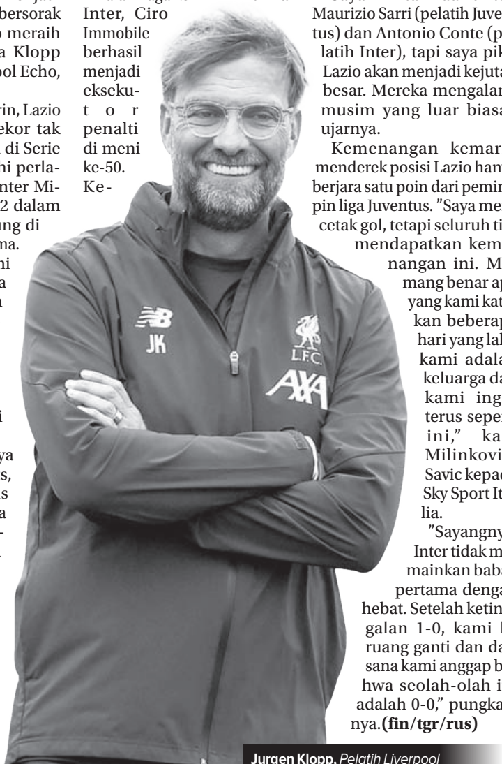
Jurgen Klopp, Pelatih Liverpool

Dalam laga kontra Inter, Ciro Immobile berhasil menjadi eksekutor penalti di menit ke-50. Ke-