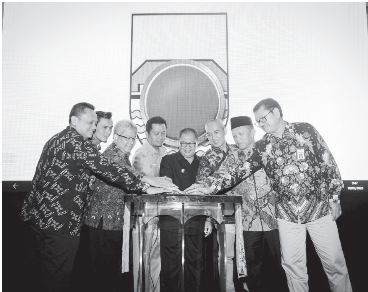
BUKA ACARA: Wali Kota Bandung, Oded M. Danial membunyikan alarm sebagai tanda pelaksanaan pelatihan sosio-kultural para kepala OPD dimulai.

"Jika kondisi ini terus menerus dilakukan, maka lama kelamaan kondisi TPA Sarimukti akan penuh juga, sehingga kejadian tutupnya TPA sebagaimana halnya dulu pada saat eks TPA Leuwigajah longsor akan terulang kembali dan Kota Bandung menjadi Lautan Sampah dapat terjadi kembali," pungkasnya. (rls/ziz)