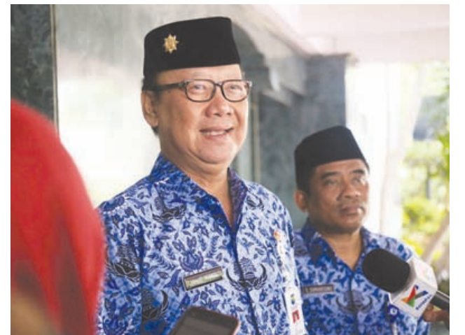
TJAHJO KUMOLO Menteri Pendayagunaan Aparatur Negara dan Reformasi Birokrasi