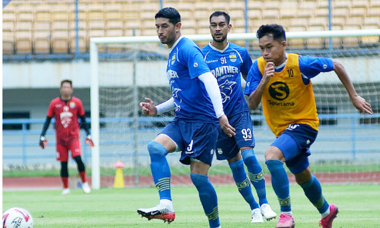
LAGA UNIK: Persib Bandung bakal hadapi dua laga uji coba unik, di mana laga tersebut akan berlangsung dalam jeda waktu satu hari.