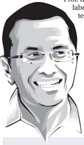
Oleh: Dahlan Iskan