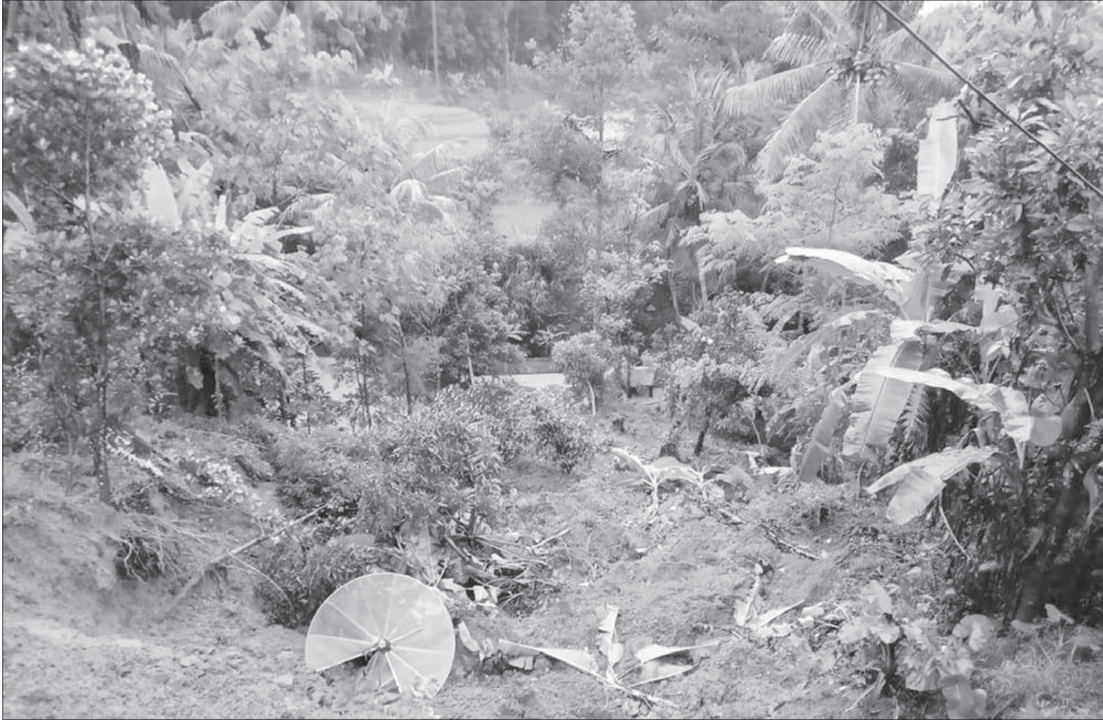
LONGSOR: Bencana longsor terjadi di Dusun Cibareubey RT 02 RW 09 Desa Sukamanah Kecamatan Jatininggal saat diguyur hujan dengan intensitas tinggi. Sementara di hari yang sama, bencana lainnya seperti pergerakan tanah dan banjir, juga melanda sejumlah pelosok desa lainnya yang ada di Kabupaten Sumedang.