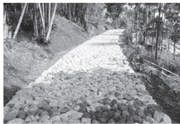
SULIT DILINTASI: Jalan menuju Gunung Haruman sulit dilintasi karena belum diperkeras dengan alat berat.

GARUT - Petani yang berkebun di Gunung Haruman, Desa Cipareuan, Kecamatan Cibiuk, Kabupaten Garut menuntut agar akses ke gunung haruman segera diperkeras dengan alat berat stoomwals. Sebab petani kesulitan melintas jalan menuju Gunung Haruman yang saat ini tengah dilaksanakan proyek jalan tersebut.