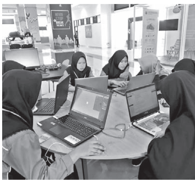
IKUTI PELATIHAN: Para peserta incubasi digital yang bergerak di bidang industri digital kreatif mendapat pelatihan gratis selama setahun penuh.

"Hal tersebut sangat membantu dalam pengurangan sampah di Kota Cimahi untuk mencapai target pengurangan 30 persen sampah," pungkasnya. (mg3/ziz)