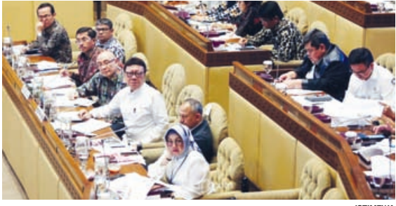
RAKOR BERSAMA: Menpan RB Tjahjo Kumolo saat rakor bersama DPR membahas soal nasib honorer atau PPPK belum lama ini.