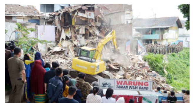
PENGUSURAN LAHAN: Satuan Polisi Pamong Praja Pemkot Bandung menggunakan alat berat untuk membongkar bangunan yang ada di RW 11 Kelurahan Tamansari, Kecamatan Bandung Wetan beberapa waktu lalu.