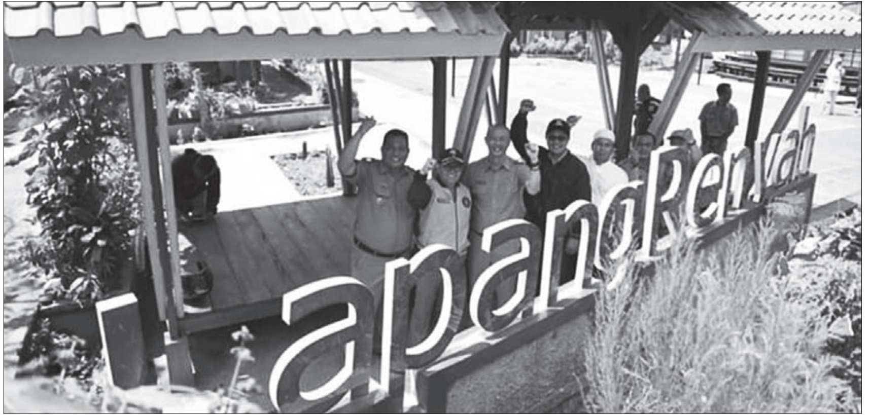
FASILITAS UMUM:Wali Kota Sukabumi, Achmad Fahmi bersama rombongan saat meninjau di salah satu Lapang Renyah, Senin (20/1).

Sigma 2020 dilaksanakan sejak Senin sampai Sabtu (20-25/1). (rls)