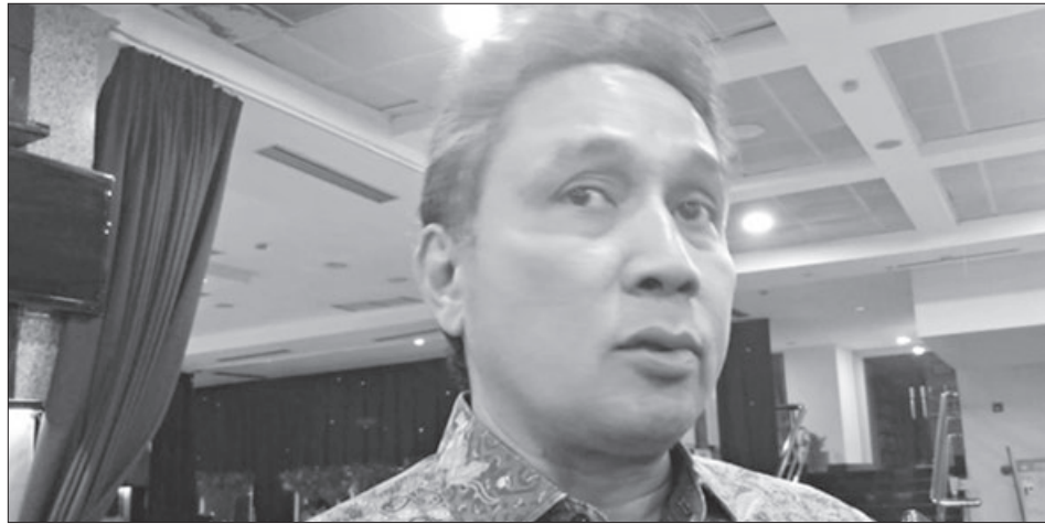
Hilmar Farid Dirjen Kebudayaan Kemendikbud

Iwan menututkan, ada juga kemungkinan masyarakat yang ikutan karena diiming-imingi sesuatu. Karena, pola pikir ingin sesuatu yang serba instan, ikutlah juga. "Yang jelas kalau sudah ada ke arah penipuan, aparat yang harus bertindak. Khawatir eksisnya semakin besar juga," tukasnya. (atp)