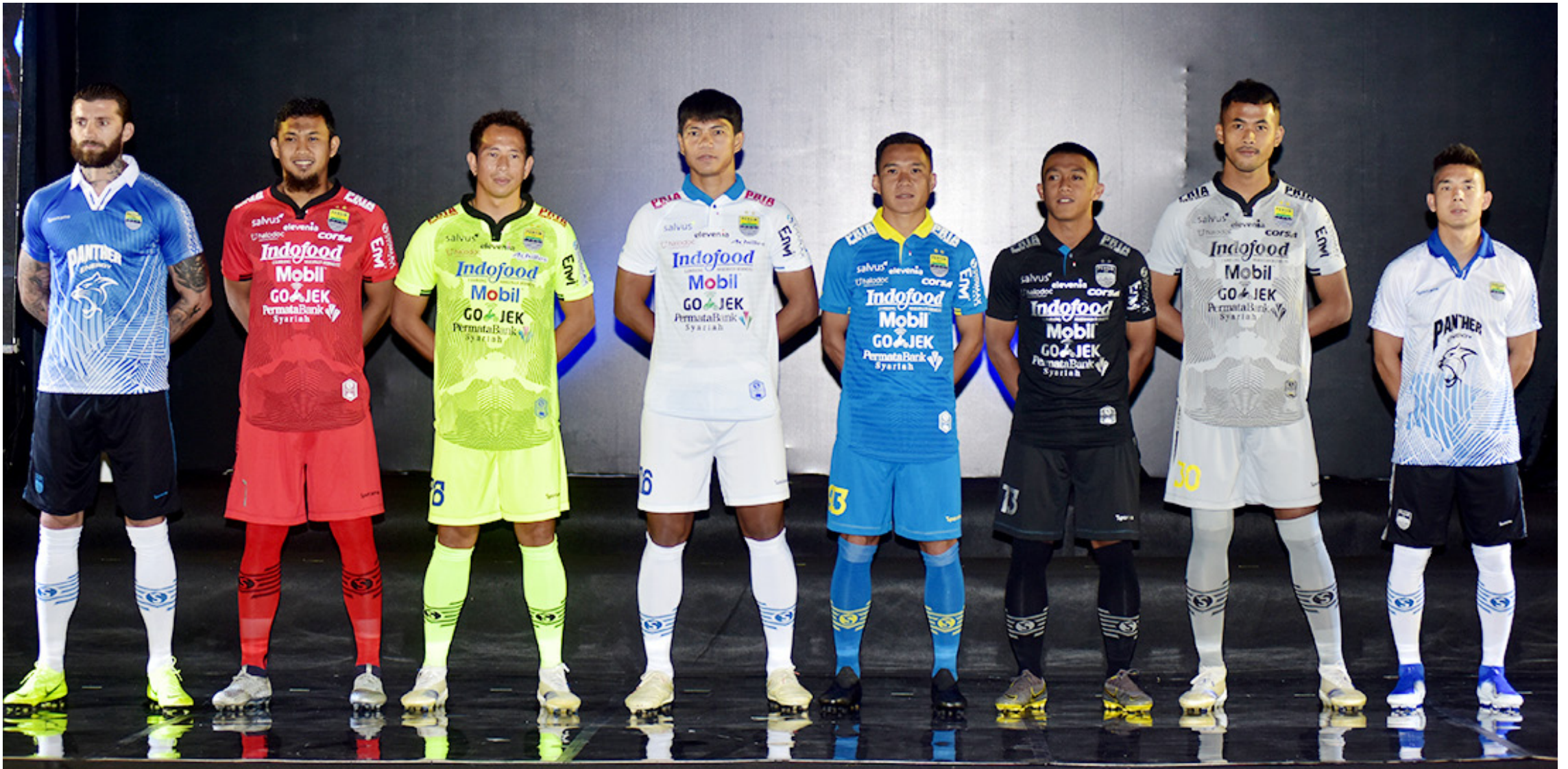
LOYALITAS PEMAIN: Pemain Persib diharapkan memiliki loyalitas yang tinggi terhadap tim. Manajemen akan bersikap tegas siap membuang pemain yang hanya setengah hati membela Maung Bandung.