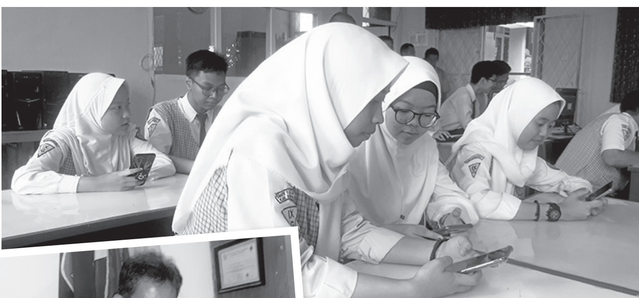
MUDAH MENAKSES: Siswa Sisi SMPN 1 Cileunyi sedang menerapkan pembelajaran melalui sistem IT, mereka mengakui optimistis dan siap untuk mengikuti TO dan UNBK yang akan digelar April mendatang.

Menurutnya, untuk keberlangsungan e-Learning di SMPN 1 Cileunyi, semua