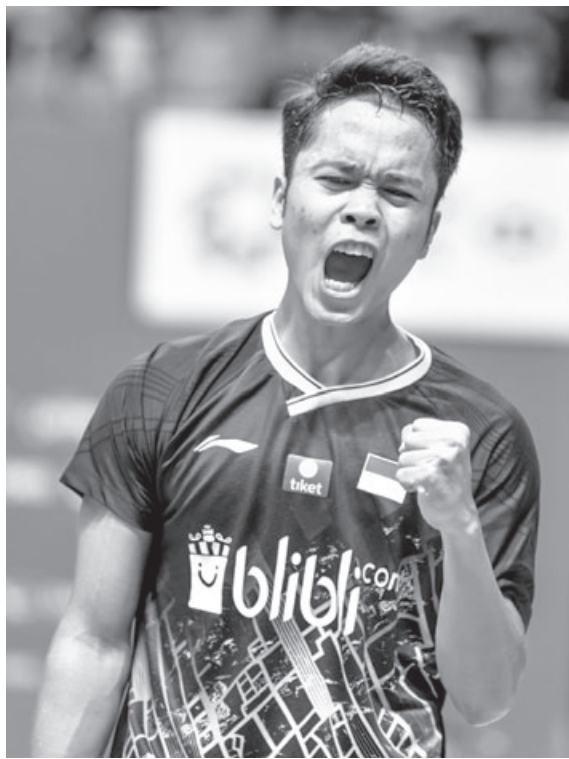
Anthony Sinisuka Ginting Peraih Juara Indonesia Masters 2020