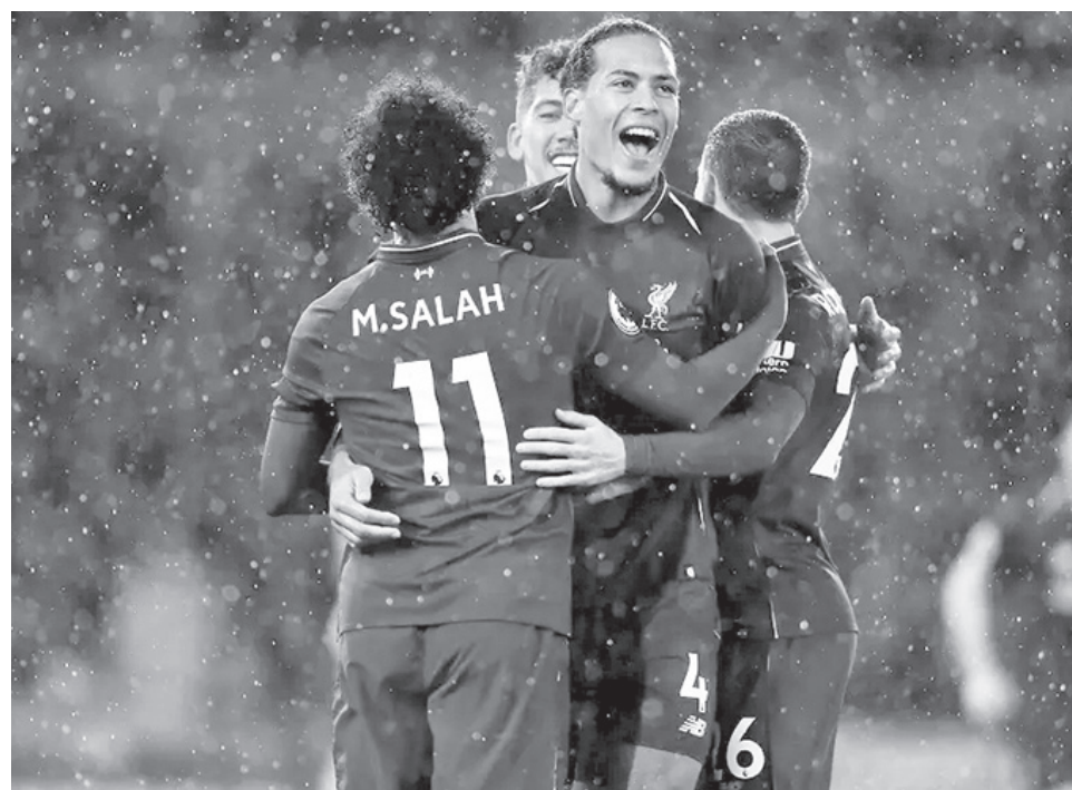
SELEBRASI KEMENANGAN: Pemain the eds merayakan setelah mencetak gol di pertandingan menjamu Manchester United di Liga Inggris.

Pada gim ketiga, pertahanan yang dibuat Anthony sulit ditembus oleh lawannya, bahkan ia berusaha memanfaatkan serangan balik untuk mencuri angka di saat stamina Antonsen mulai melemah setelah meladeni pukulan reli. Dalam catatan pertemuan sebelumnya, Anthony sudah membukukan skor 2-0 atas Antonsen. Dua pertemuan sebelumnya terjadi di Malaysia Masters 2018 dan Cina Open 2019. (gje/ful/fin)