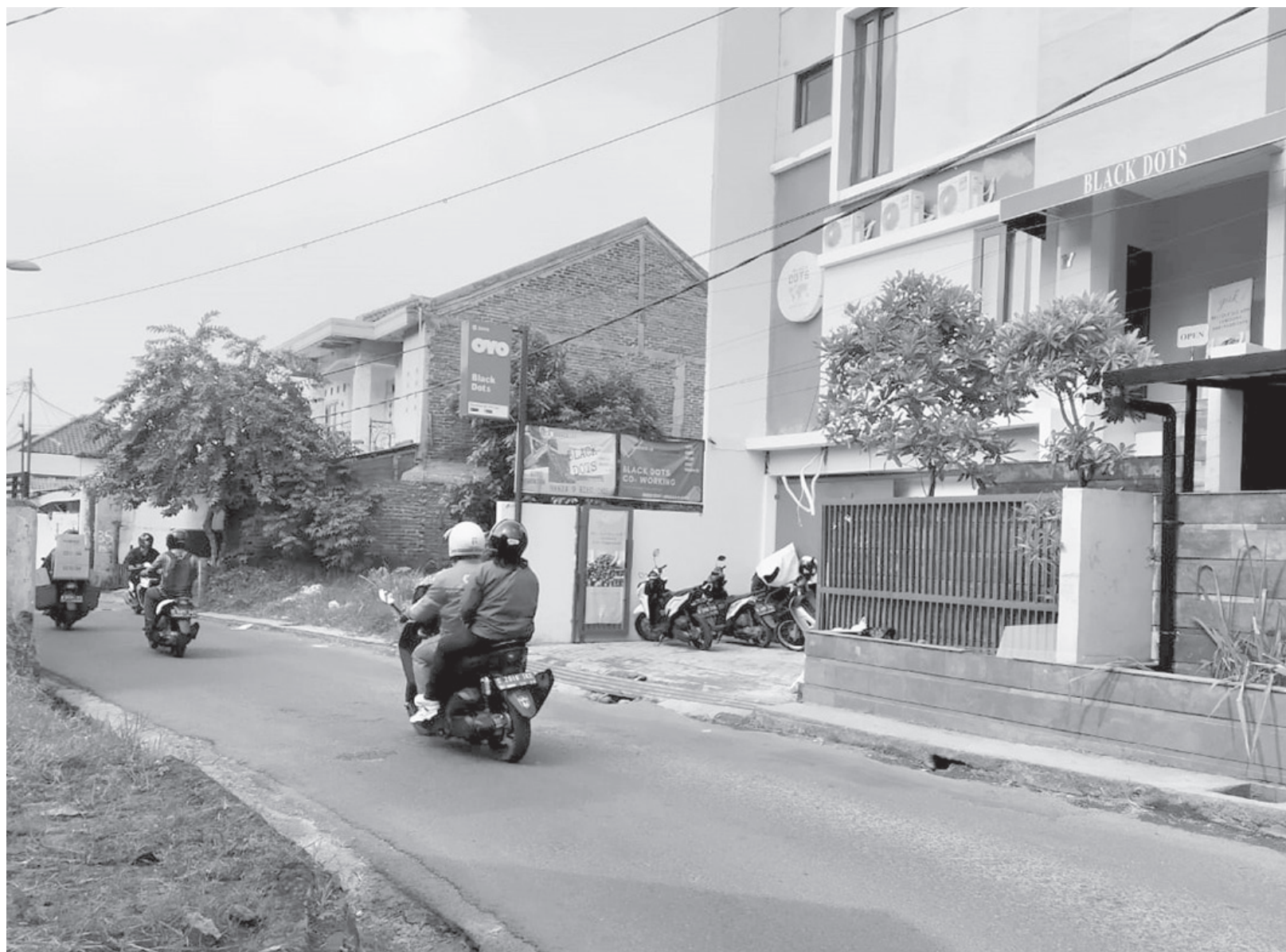
ABAIKAN IZIN: Setelah mendaftar lewat OSS, pemilik Black Dots Hotel mengabaikan pembuatan izin lainnya melalui Pemerintah Daerah. Padahal, ada sejumlah izin yang harus ditempuh agar pemilik memperoleh legalitas sebagai tempat usaha.

"Dengan diberikan SP kami berharap mereka akan datang kemari dan mencari solusi yang benar. Dan jika memang sudah mempunyai persyaratan lengkap maka izin akan segera keluar," pungkas Hella. (mg3/ziz)