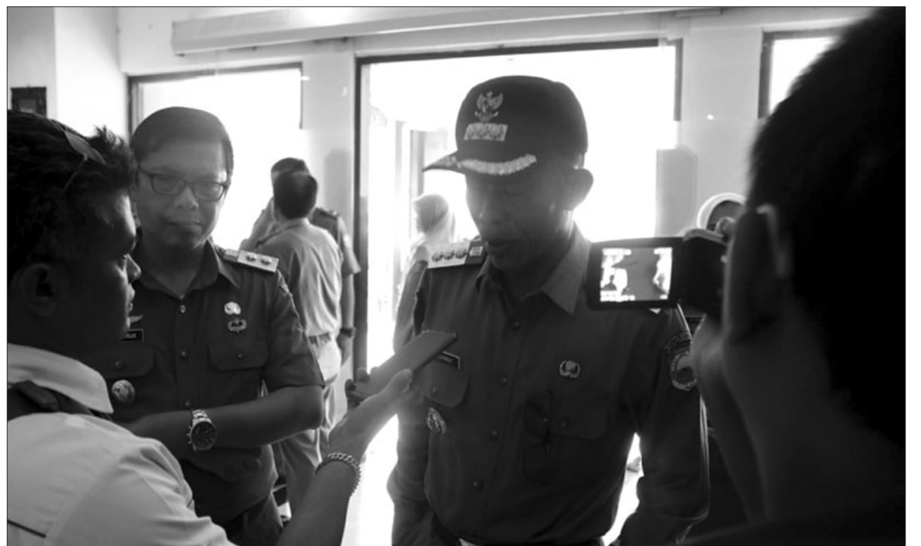
BUPATI: Subang H Ruhimat saat menjenguk korban laka di RSUD Subang.

Karena menurut Ruhimat, sejak memasuki wilayah Subang, medan jalan dari perbatasan Bandung Barat Subang hingga ke Subang Kota, banyak sekali turunan yang curam. Serta belokan tajam, sehingga bagi para pengguna jalan yang baru pertama melintasi Subang Selatan panik, dan berakibat mengalami kecelakaan fatal. Seperti halnya yang dialami oleh pengendara bus pariwisata yang mengalami kecelakaan kemarin. "Rata-rata yang mengalami kecelakaan maut di jalur