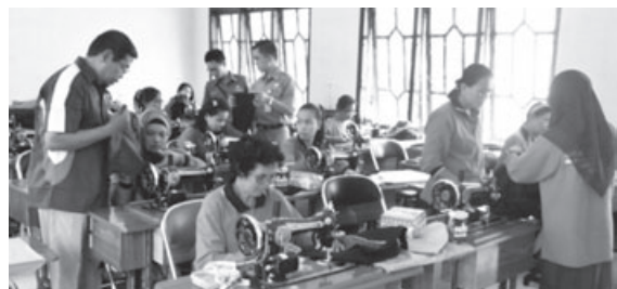
BERI KETERAMPILAN: BLK Komunitas adalah unit pelatihan kerja yang didirikan di lembaga pendidikan keagamaan dengan tujuan memberikan bekal keterampilan teknis berproduksi atau keahlian vokasi sesuai kebutuhan pasar kerja.