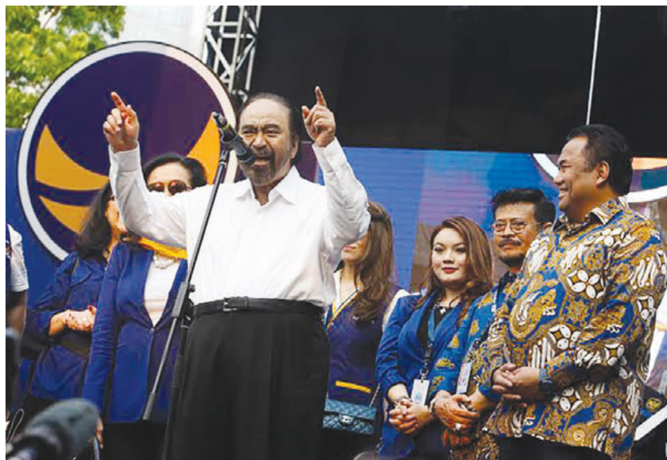
BERIKAN SAMBUTAN: Ketua Umum Partai NasDem, Surya Paloh saat memberikan orasi di hadapan para kader dan simpatisannya.

JAKARTA- Menjelang penyelenggaraan Pilkada Serentak 2020, Parta NasDem menggelar konsolidasi struktur partai untuk Provinsi Kalimantan Barat (Kalbar) di Pontianak, Sabtu (18/1). Konsolidasi dilakukan untuk memantapkan mesin partai agar lebih maksimal untuk memenangkan raih kursi di setiap daerah.