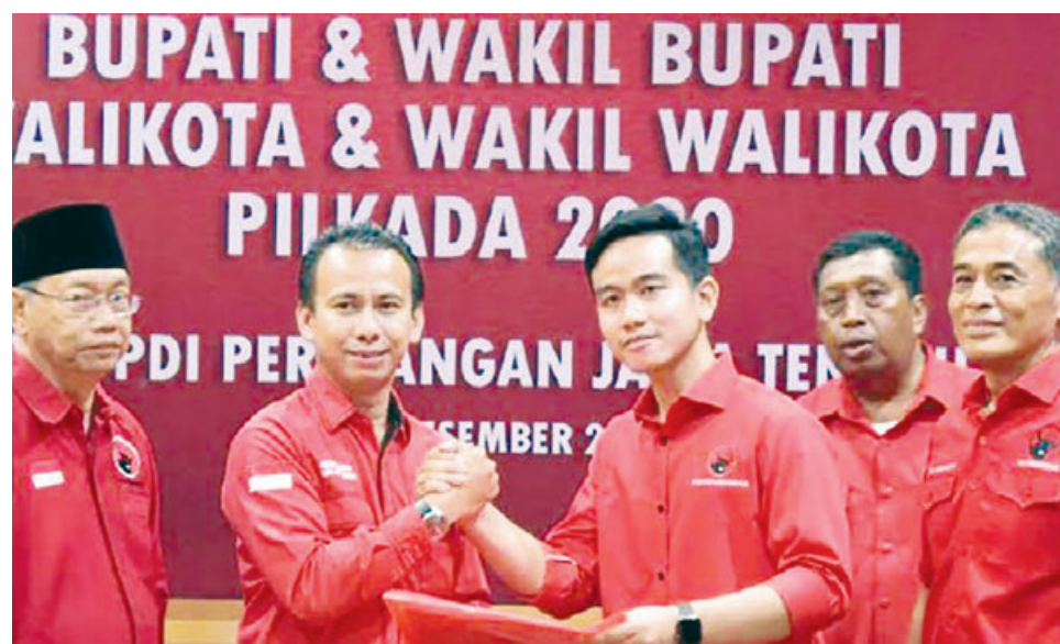
DAFTAR PILKADA: Gibran Rakabuming Raka saat akan maju untuk Pilkada Solo melalui PDIP belum lama ini.

Menanggapi putusan ini, Rommy memilih untuk berpikir, sehingga tidak serta-merta menerima putusan hakim. Dia mempunyai hak untuk menerima maupun mengajukan banding atas putusan hakim. (jpc/drx)