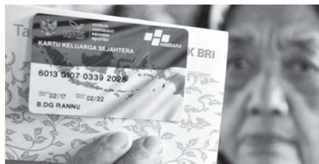
PROGRAM BANTUAN: Alokasi calon penerima Program Sembako dari Kementerian Sosial (Kemensos) tahun 2020 di Kota Cimahi mencapai 17.030 Keluarga Penerima Manfaat (KPM) atau bertambah sekitar 500 orang.

"Jadi sekarang lebih lengkap. Mudah-mudahan dapat membantu masyarakat memenuhi kebutuhan gizi, terutama