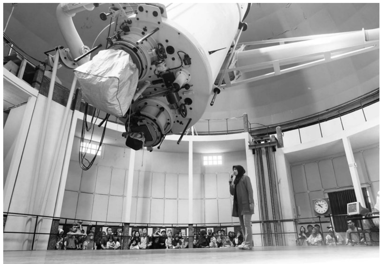
WISATA EDUKASI: Keberadaan Bosscha sebagai tempat cagar budaya yang juga wisata edukasi ini kerap dikunjungi para pelajar dari berbagai daerah yang datang ke Lembang.

"Kalau yang namanya menyimpang, apalagi bertentangan dengan aturan-aturan dasar negara serta sudah keluar dari ideologi Pancasila, jelas harus segera ditindak," tandasnya. (drx)