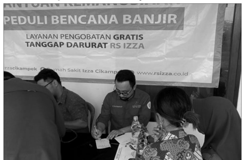
ACARA pemberian bantuan langsung dari Manajemen RS Izza Cikampek untuk korban banjir Cilamaya.

angkutan barang maupun umum, berupa oper dimensi dan oper loud. Untuk itu Pemkab Subang dalam waktu dekat ini segera mengusulkan, ke pemerintah Provinsi Jawa Barat, terkait semua kebutuhan untuk rambu-rambu dan rest area khusus pegujian. (rls/rie)