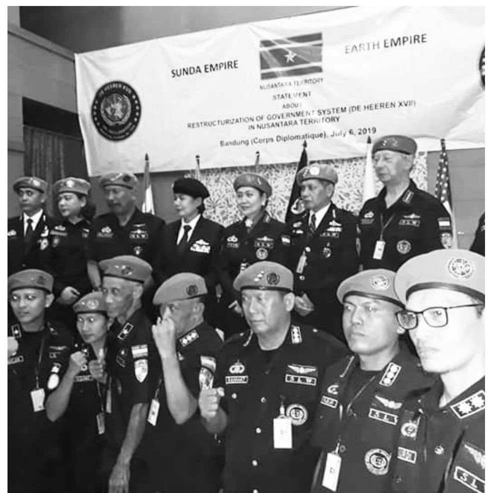
ANGGOTA SUNDA EMPIRE: Kelompok Sunda Empire sempat menghebohkan masyarakat dan saat ini tengah diselediki oleh Polda Jabar.

Di antara situs yang sudah terpelihara dengan baik, yaitu Situs Guha Pawon atau Stone Garden di Kecamatan Cipatat. Saat ini, situs berupa bentangan bebatuan alam tersebut dikelola oleh masyarakat setempat yang tergabung dalam Kelompok Sadar Wisata Pasirpawon. Pokdarwis ini bahkan pernah meraih penghargaan juara 2 nasional beberapa waktu lalu. (drx)