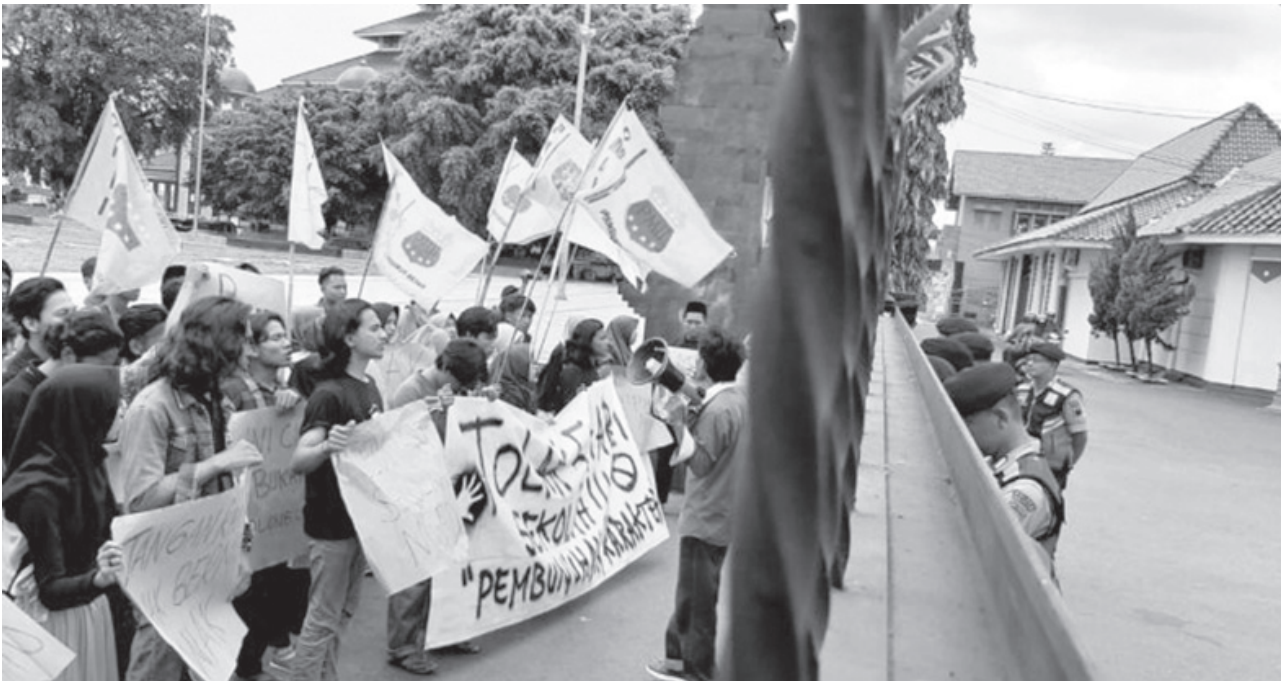
MAHASISWA MENOLAK: Kebijakan lima hari sekolah mendapatkan penolakan dari Pergerakan Mahasiswa Islam Indonesia (PMII) Kabupaten Cilacap.

"Kebijakan ini juga dilator belakangi, agar angka kenakalan di tingkat anak-anak menurun, ini bisa diterapkan di