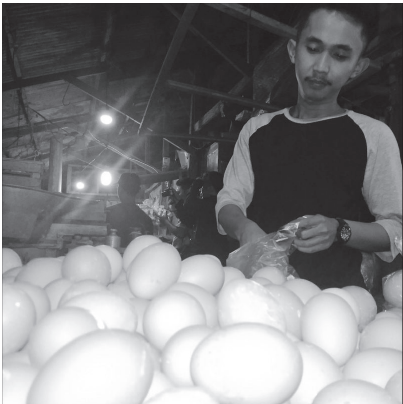
YUGO EROSP/PASUNDAN EKSPRES

CEK RUTIN: DKUPP rutin melakukan pengecekan telur di Pasar Tradisional. Hal itu untuk memastikan tidak ada telur ayam palsu.