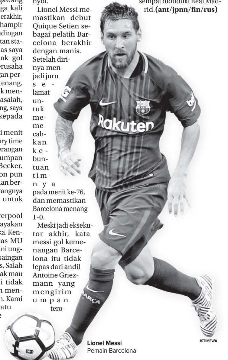
Lionel Messi Pemain Barcelona

Setelah kebobolan gol Messi dan kondisi sudah tertinggal satu gol, Granada tak banyak bisa melakukan apa pun kecuali mengakui keunggulan Barcelona dalam laga debut Setien. Kemenangan tersebut, membawa Barcelona naik kembali ke puncak klasemen dengan raihan 43 mengambil alih posisi yang sempat diduduki Real Madrid. (ant/jppn/fin/rus)