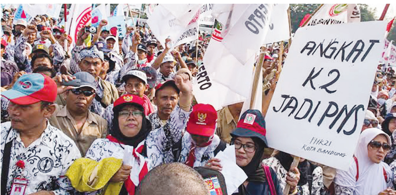
GELAR AKSI: Ribuan anggota PGRI saat menggelar aksi unjuk rasa menuntut pemerintah untuk mengangkat para guru honorer menjadi PNS beberapa waktu lalu.

Sedangkan bila digabungkan dengan lainnya jumlahnya tidak hanya jutaan tetapi bisa puluhan juta karena sampai saat ini perekrutan pegawai non-PNS masih terus berlangsung. (esy/jpnn)