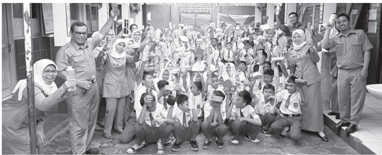
SEGERA DIBERLAKUKAN: Penggunaan tempat makan dan minum tidak sekali pakai yang diberlakukan di SDN Cimahi Mandiri 1 mampu mengurangi produksi sampah di lingkungan sekolah. Dari yang asalnya menghasilkan 38 kilogram menjadi hanya lima kilogram.

"Kita akan terus roadshow ke sekolah-sekolah untuk