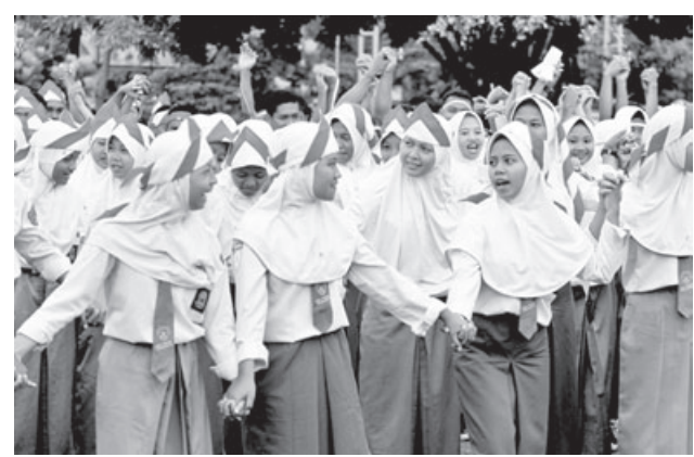
TOLAK RADIKALISME: Para pelajar di Jawa Barat menolak radikalisme dan hoaks.

Cilacap Budi Santosa mengatakan jika penerapan lima hari sekolah, secara kurikulum tidak akan menambah jam belajar siswa. Karena jam belajar siswa selama satu minggu masih tetap sebanyak 40 jam. Hanya saja biasanya dilaksanakan dalam enam hari sekolah, kini menjadi lima hari sekolah. Penerapan lima hari sekolah juga dilaksanakan kepada sekolah yang sudah siap. (ale/bbs/tur)