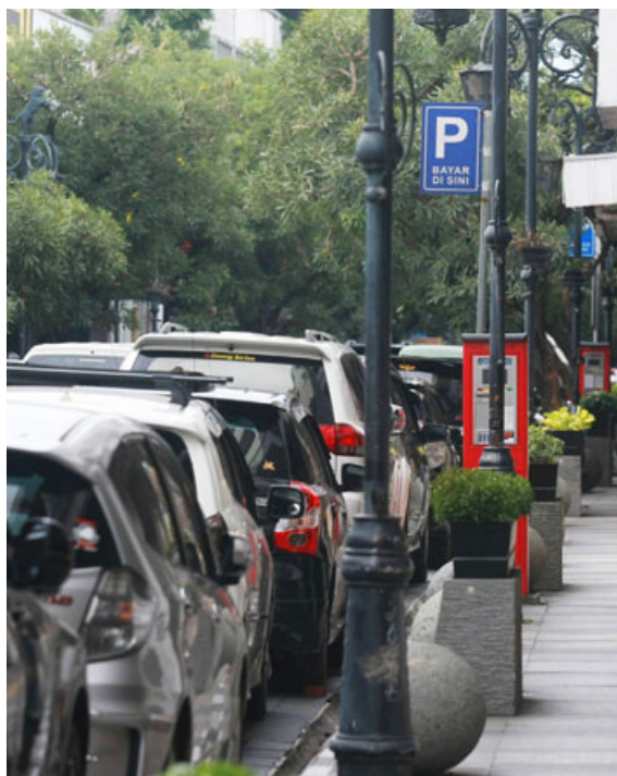
PENYEBAB KEMACETAN: Puluhan kendaraan roda empat tampak terparkir di sepanjang Jalan Braga.