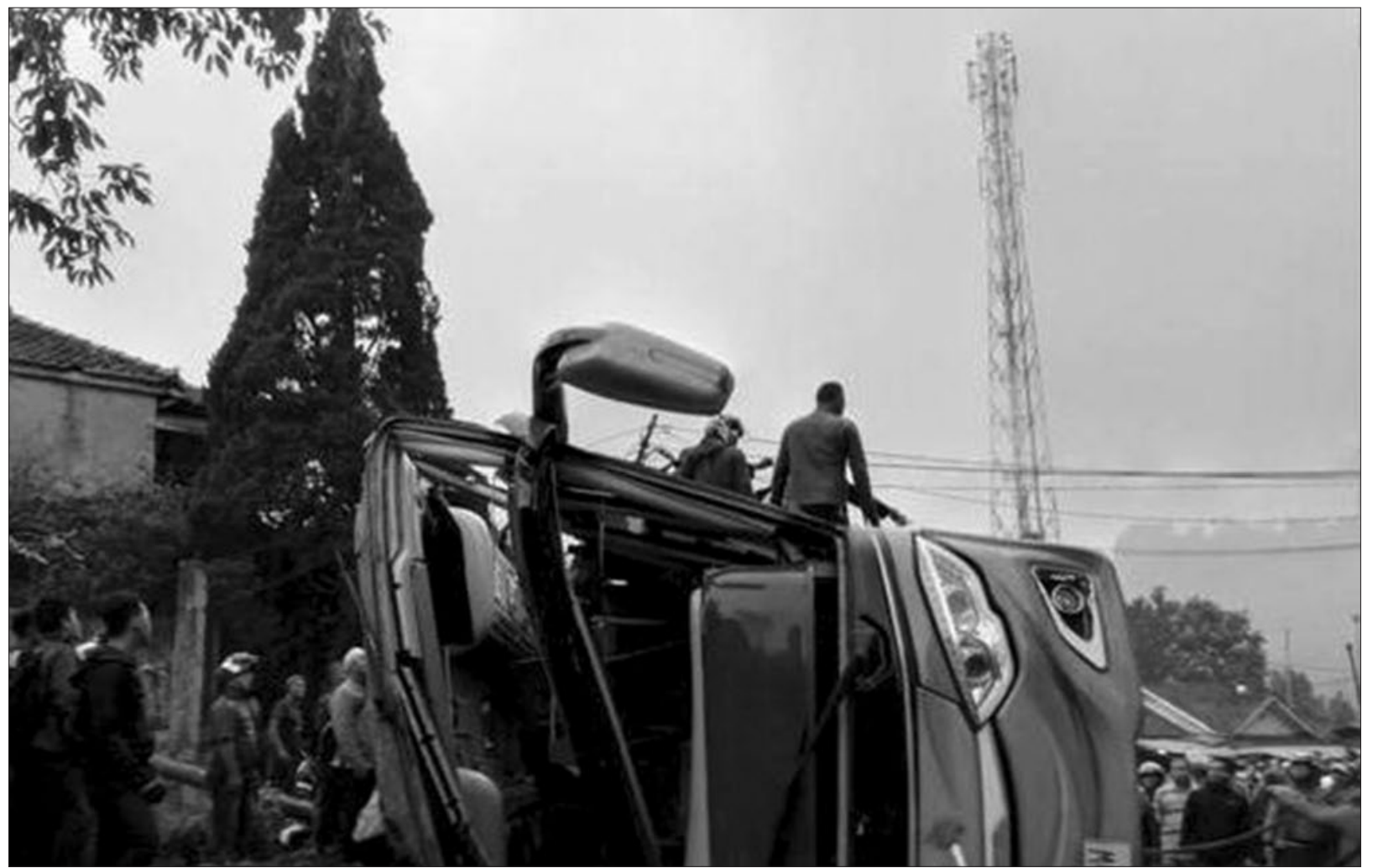
USUT PENYEBAB: Bus yang mengalami kecelakaan maut di Ciater menewaskan delapan orang anggota Posyandu Depok dari. Korlantas Polri turun tangan mengusut kecelakaan tersebut.

Kelas VIP Kelas Penunjang Medis Kami menyediakan ruang-ruang khusus kepada para pasien untuk menjalankan berbagai kenyamanan dan senantiasa menyediakan kebutuhan yang senantiasa menjaga performa mereka. (dri)