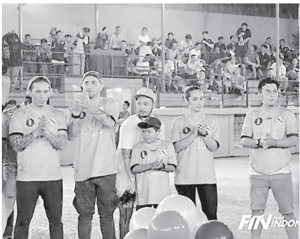
SIAP BERLAGA: Sejumlah pemain film ikut merayakan turnamen Tobaboy di lapangan Hijau, Kawasan Cilandak, Jakarta, (14/1). Lingkar Film menghadirkan beberapa artis di film mangga muda seperti Gerry Iskak, Pasha, Alexandra Gurtado, dan masih banyak lain nya, untuk meresmikan Turnamen TobaBoy Soccer.

Pemain menurut Indah juga diberikan program yang tepat agar bisa recovery lebih cepat dan menjalani latihan dengan maksimal. "Sudah gitu aja. Soalnya mereka lagi pada mau berenang, jadi ngak bisa saya tanya lebih panjang ke mereka takut mengganggu," pungkasnya. (dkk/jpnn)