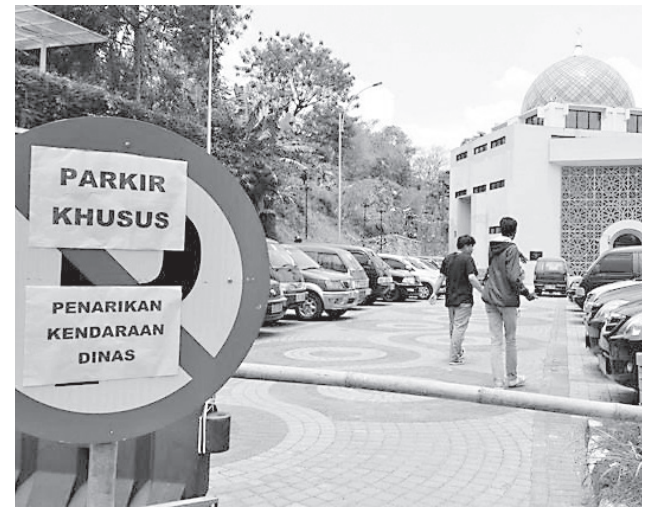
TARIK KENDARAAN DINAS: Tahun ini Pemkot Cimahi secara bertahap mulai menarik kendaraan dinas untuk dihapuskan dan sebagai kompensasi para ASN akan menerima tunjangan transportasi. Namun kebijakan itu ada pengecualian bagi SKPD yang berkaitan langsung dengan pelayanan.

"Semua kendaraan yang dipegang dinas ditempel stiker 'Kendaraan Operasional' maka kendaraan itu tidak boleh dikuasai satu orang. Terlebih, ada hibauan dari Sekda Kota Cimahi," pungkasnya. (mg3/ziz)