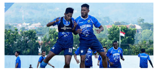
BUKAN TARGET UTAMA: Turnamen Asia Challenge Malaysia bukan menjadi target utama Persib untuk memenangkan setiap laga.