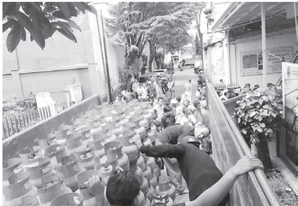
PENDISTRIBUSIAN GAS: Puluhan warga Kota Cimahi tampak sedang mengantri membeli gas LPG 3 Kg. Sejahter ini pendistribusian gas LPG bersubsidi tersebut dinilai masih kurang tepat sasaran. Sebab, masih banyak warga mampu menggunakan gas simelton itu.

CIMAHI - Dinas Perdagangan Koperasi UMKM dan Perindustrian (Disdagkoperind) Kota Cimahi memastikan pasokan Liquefied Petroleum Gas (LPG) tiga kilogram alias gas melon aman untuk memenuhi kebutuhan warga Kota Cimahi sepanjang tahun 2020.