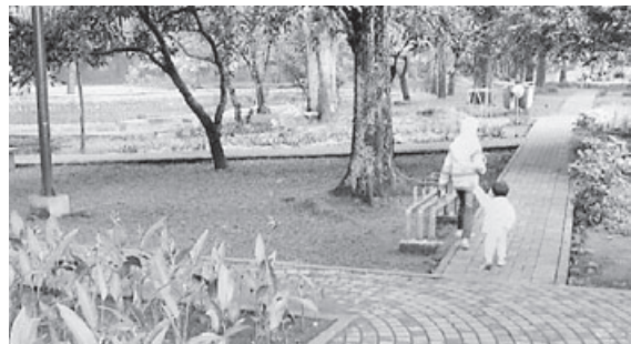
SERAHKAN ASET: Tahun ini ada enam Fasos dan Fasom perumahan yang menjadi sasaran agar asetnya diserahkan kepada Pemkot Cimahi.