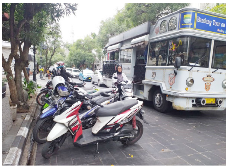
SEGERA DISTERILKAN: Kawasan Braga dalam waktu dekat akan terbebas dari aktivitas sejumlah parkir motor dan mobil untuk menciptakan ikon baru atau 'walkingspace'.