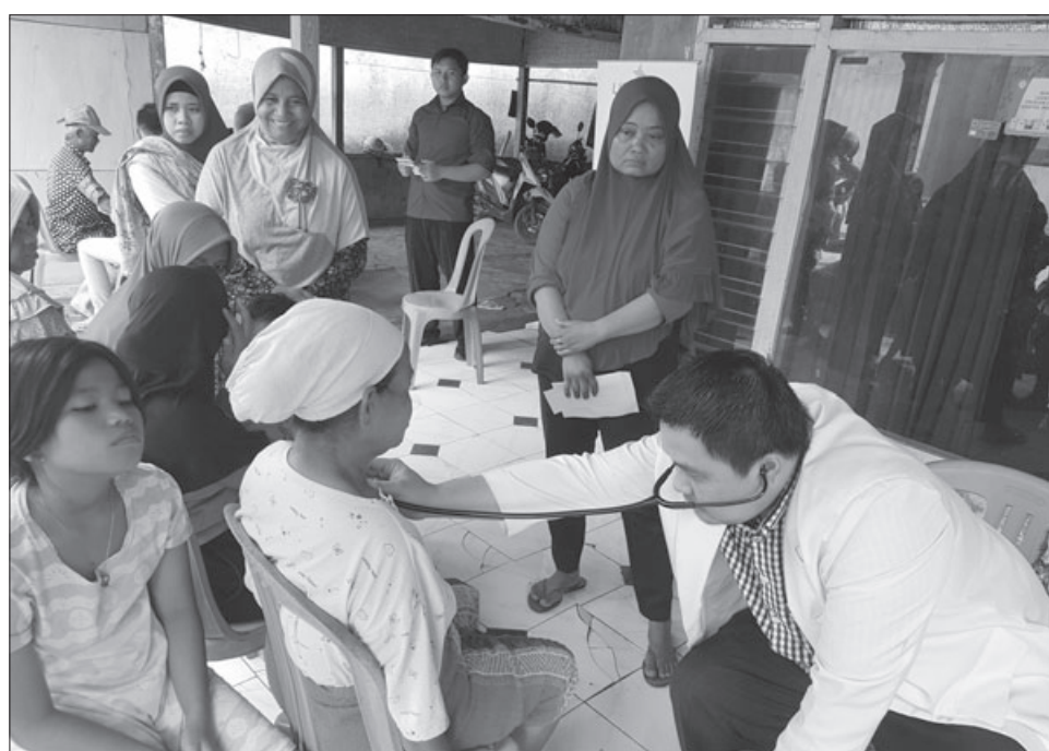
DEDY SATHRIA/PASUNDAN EKSPRES