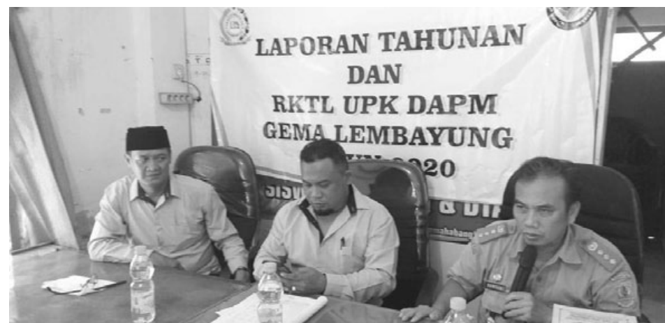
LAPORAN : Ketua Badan Oengawas UPK Kecamatan Lemahabang, saat memimpin rapat laporan tahunan SPP DAPM Gema Lembayung.

Terlebih lagi, perpanjangan masa darurat bencana ini juga mengikuti prediksi cuaca puncak musim hujan yang diperkirakan akan berakhir Maret 2020. (bbs/rie)