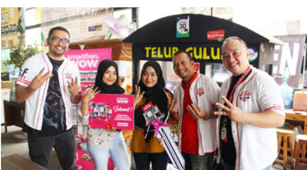
RAIH HADIAH: Pelanggan Smartfren saat menunjukan hadiah rumah dan mobil lewat program Undian Smartfren WOW.

BANDUNG- Masih belum punya rumah juga di tahun 2020 atau masih belum punya mobil dan motor? Gak perlu nunggu lama untuk mimpi jadi kaya dulu. Ya, sebagian besar orang pasti punya mimpi untuk kaya. Tidak jarang juga yang pakai jalan pintas untuk jadi kaya, bahkan sampai menggunakan cara yang tidak seharusnya dilakukan. Terus gimana caranya?