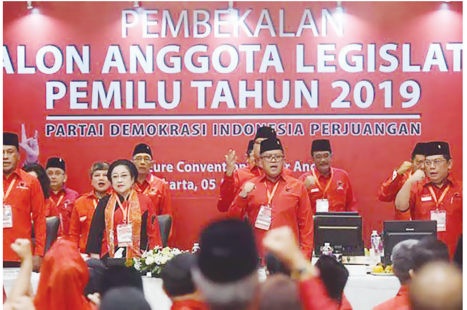
UNTUK KEMENANGAN PILEG: Ketua umum dan pendiri Partai Demokrasi Indonesia Perjuangan (PDIP) Megawati Soekarno Putri melakukan konsolidasi partai bersama ribuan kader.

Penolakan serupa juga disampaikan PPP. Wasekjen PPP Achmad Baidowi mengatakan jika ambang batas parlemen bertambah, maka jutaan suara rakyat akan sia-sia.