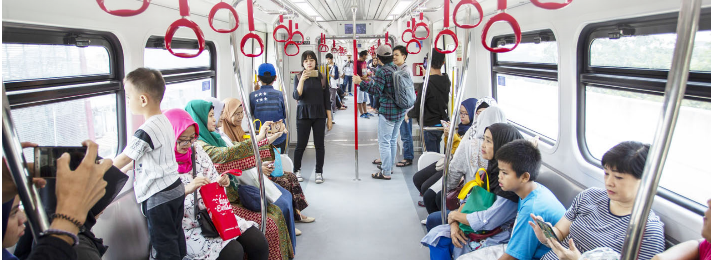
NIKMATI PERJALANAN: Sejumlah warga saat menikmati perjalanan menggunakan transportasi massal berupa LRT yang ada di Jakarta. Rencananya, Kota Bandung akan memiliki LRT.