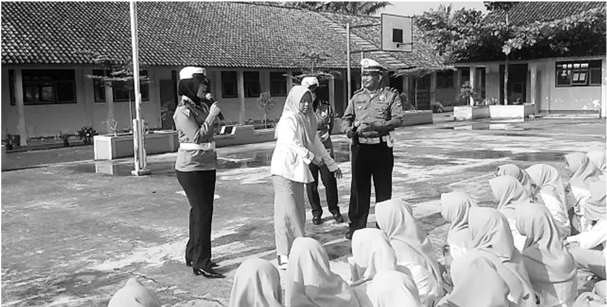
SOSIALISASI: Kepolisian Resor Kota Banjar, melaksanakan sosialisasi program Police Goes To School melalui Satuan Lalu Lintas Unit Dikyasa, di SMKN 4 Kota Banjar.