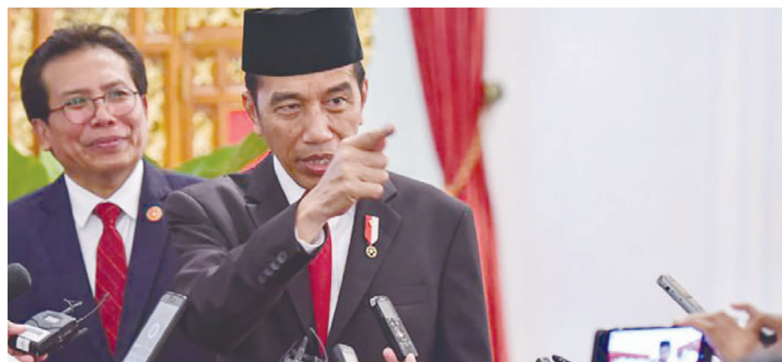
BERSAMA MEDIA: Presiden Joko Widodo memberikan keterangan di Istana Negara terkait kondisi dan situasi keamanan di Indonesia.

JAKARTA- Presiden Joko Widodo ikut menghadiri acara Pelantikan Pengurus Himpunan Pengusaha Muda Indonesia (HIPMI) periode 2019-2022 yang digelar di Hotel Raffles, Jakarta pada Rabu (15/1). Pada kesempatan tersebut, Jokowi menyapa Sandiaga Salahuddin Uno yang juga hadir. Jokowi pun menyinggung Pilpres 2024.