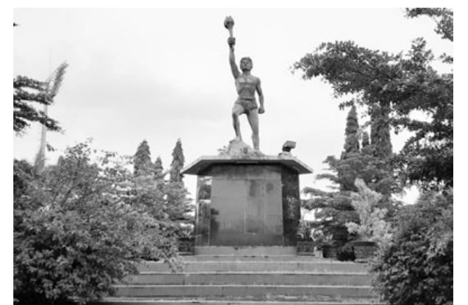
SEMANGAT: Rugu obor melambangkan semangat dalam olahraga di Kabupaten Ciamis.

"Semoga dengan tegak kokoh berdirinya pating Si Obor bisa terus memberikan semangat yang membara untuk warga tatar galuh ciamis dan bisa terus membawa semangat dalam olahraga Ciamis," katanya. (mg2)