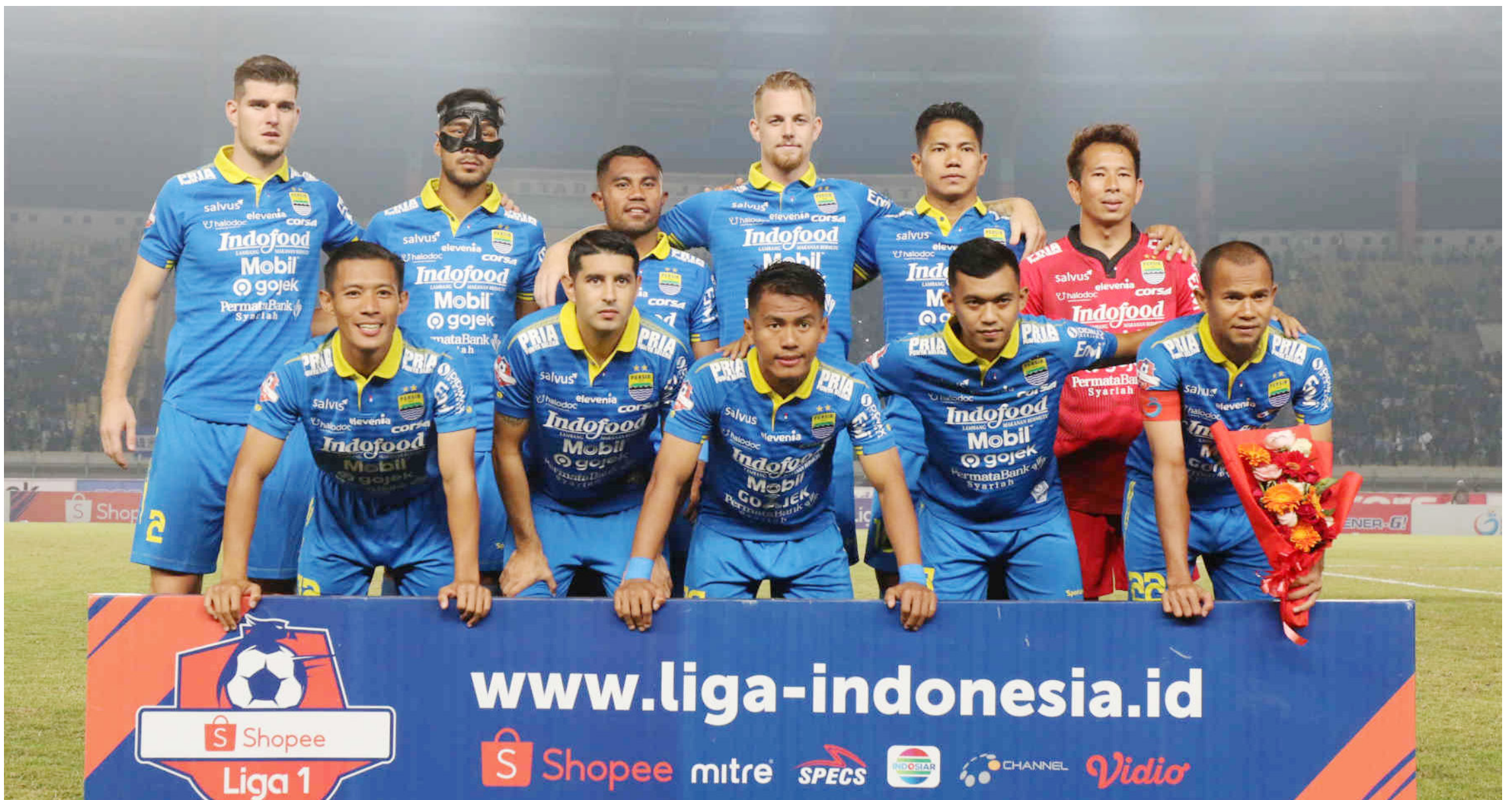
FOTO BERSAMA: Skuat kebanggaan Jawa Barat yang berjudul Pangeran Biru terlihat saat berfoto sebelum Kick Off pertandingan Shopee Liga 1 dilakukan di stadion Si Jalak Harupat (SJH), Soreang Kabupaten Bandung.