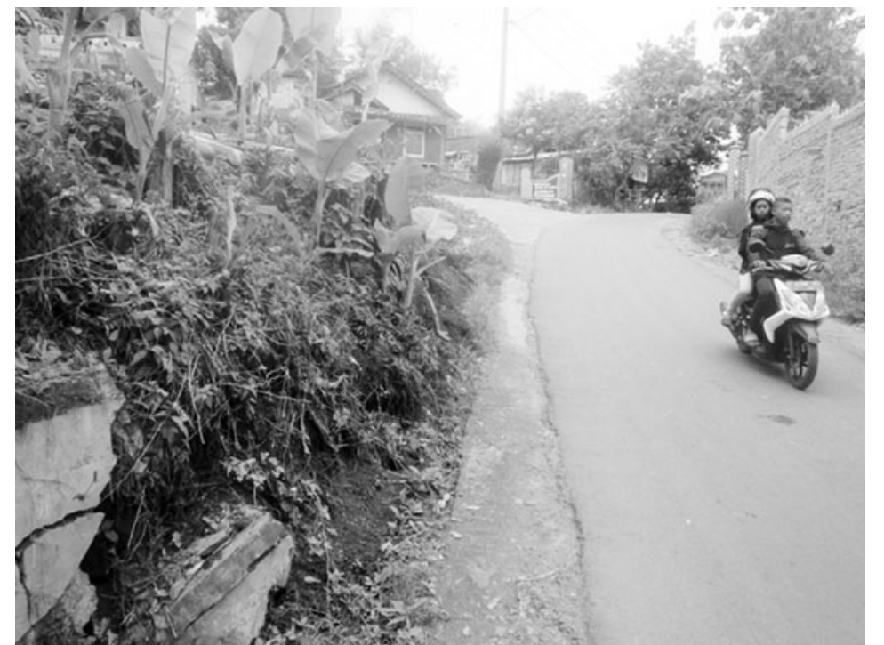
TERTUTUP: Drainase tertutup oleh bongkahan TPT yang ambrol namun hingga kini belum juga dibenahi oleh pihak terkait.

Selain itu, sisa TPT yang masih tersisa tampak sudah retak terancam ambrol lagi. Bila tak secepatnya diperbaiki, tak menutup kemungkinan drainase yang tertimbun terus bertambah. (pap)