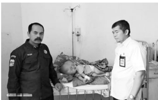
KUNJUNGI: TKSK dan Lapad Ruhama kunjungi penderita hidrosefalus.