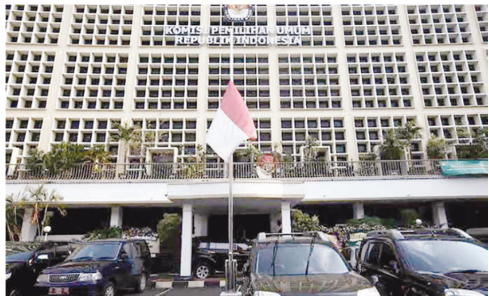
HALAMAN DEPAN: Kantor Komisi Pemilihan Umum (KPU) selalu dipenuhi oleh pengunjung dari berbagai organisasi partai pada pelaksanaan Pileg dan Pilpres 2018 lalu.

naik dari 3,5 persen, suara yang hangus bertambah. Apalagi kalau angkanya lebih dari itu," tukasnya. (rh/fin)