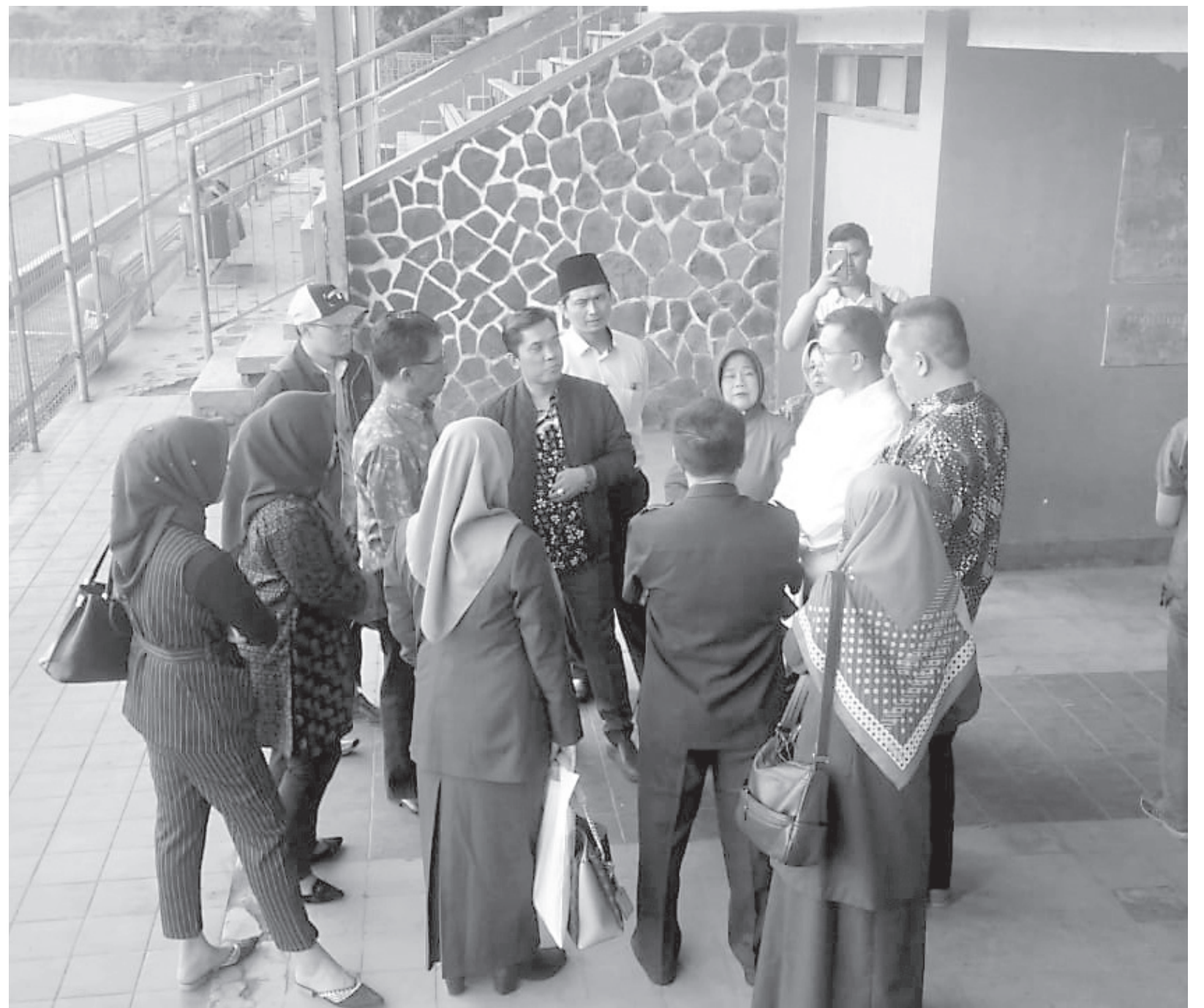
TINJAU STADION: Rombongan Komisi IV Dewan Perwakilan Rakyat Daerah (DPRD) Kota Cimahi meninjau langsung keberadaan Stadion Sangkurang yang gagal direvitalisasi, karena anggaran yang dijanjikan pihak Provinsi Jawa Barat tidak terealisasi.

Ditegaskan Ami, akusisi aset Fasos dan Fasum perumahan ini menjadi salah satu cara untuk mempertahankan dan menambah Ruang Terbuka Hijau (RTH) Kota Cimahi. "Ini program signifikan untuk menambah RTH. Jadi nanti RTH di perumahannya kita kelola biar tidak beralih fungsi," pungkasnya. (mg3/ziz)