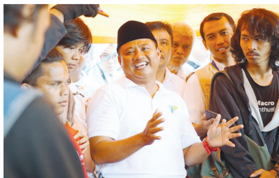
DIFASILITASI PEMPROV: Wakil Gubernur Jawa Barat Uu Ruzhanul Ulum memberikan nasehat kepada penghuni Balai Wyata Guna untuk selalu bersabar dan menawarkan solusi tempat tinggal.