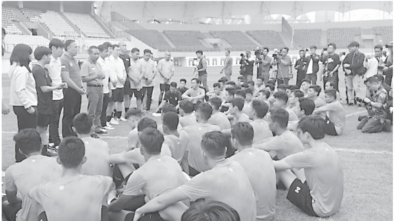
PANTAU LANGSUNG: Menpora Zainudin Amali (lima dari kiri) memberikan pengarahan kepada pemain saat memantau langsung sesi latihan perdana Timnas U-19 di Stadion Wibawa Mukti, Cikarang, Senin (13/1).

Mulai United sebagai klub yang menghancurkan karir pemain dan Pogba korbannya. Kemudian menyebut United melakukan pemaksaan kepada pemain walau hatinya sudah tak berada di Old Trafford lagi. "Masalah Pogba adalah Manchester United. Itu klub yang tidak berhubungan dengan kenyataan dan tanpa proyek olahraga," kata Raiola soal United seperti dikutip Daily Mail. "Aku tidak akan membawa siapa pun ke sana, mereka bahkan akan menghancurkan Maradona, Pele, dan Maldini. Pogba membutuhkan klub dan skuad, seperti di Juventus sebelumnya," pungkasnya. (dra/dns/jpc)