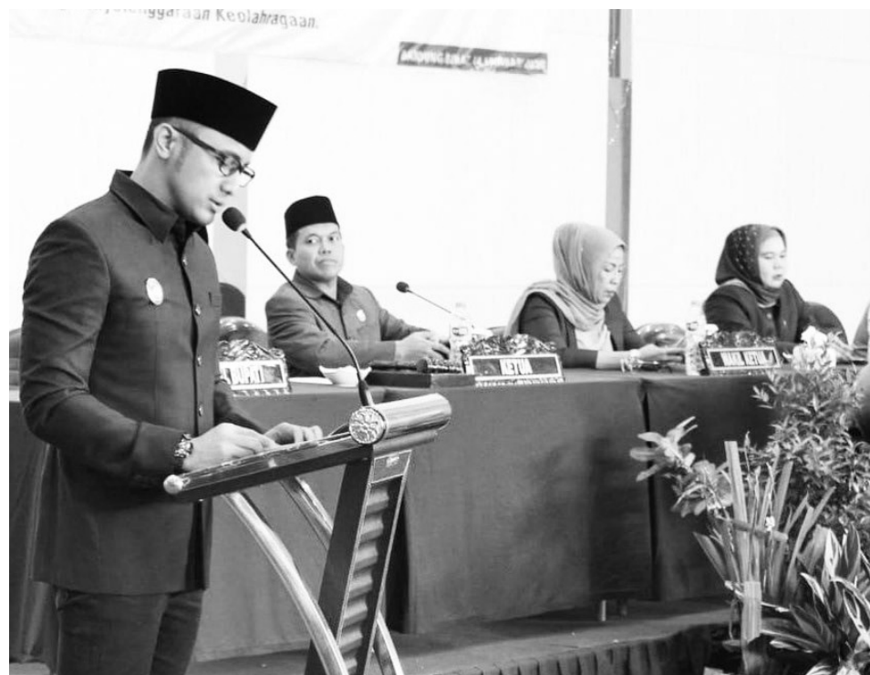
SAMPAIKAN SAMBUTAN: Wakil Bupati Bandung Barat, Hengki Kurniawan saat menyampaikan pandangan pada Rapat Paripurna untuk membahas tiga Raperda baru-baru ini.

"Dari pekan lalu saya bolak-balik ke sini (Disdukcapil), tapi katanya belum selesai soalnya ada server yang rusak. Ya jujur kecewa, karena capai juga kalau harus bolak-balik ke sini, padahal harapannya bisa dengan layanan cepat," tandasnya. (drx)