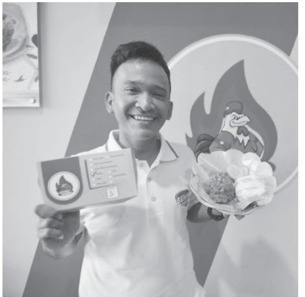
BANYAK DIGEMARI. Selebritis dan pembawa acara Ruben Onsu memperlihatkan produk ayam goreng.

“Komunikasi lancar, apa yang disampaikan oleh pihak pemerintah sampai kepada mereka, tetapi mungkin ada hal yang belum mereka kabulkan oleh kami, maka mereka bisa Sekolah seperti ini,” tutupnya. (mg1/yan)